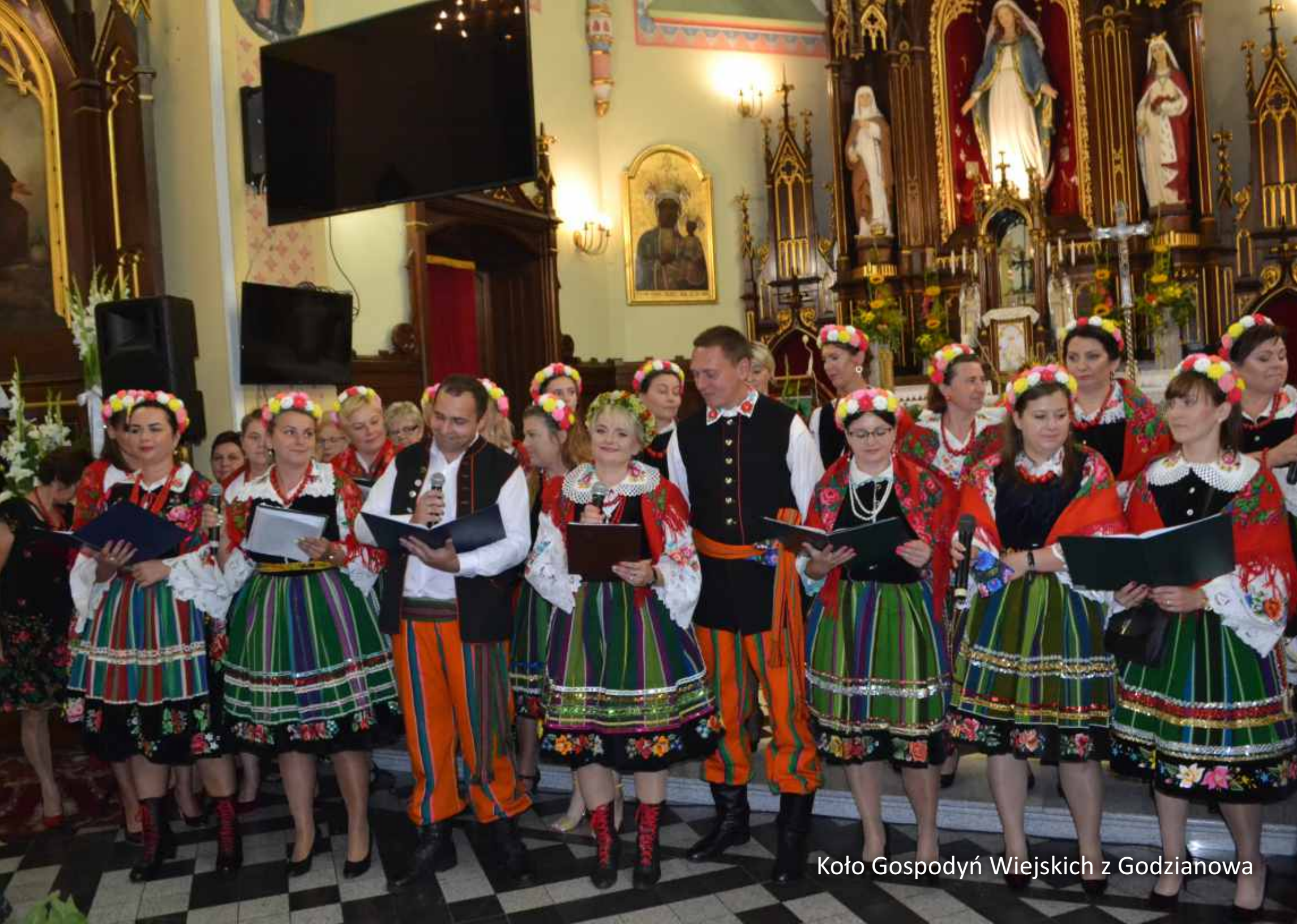
Koło Gospodyń Wiejskich z Godzianowa