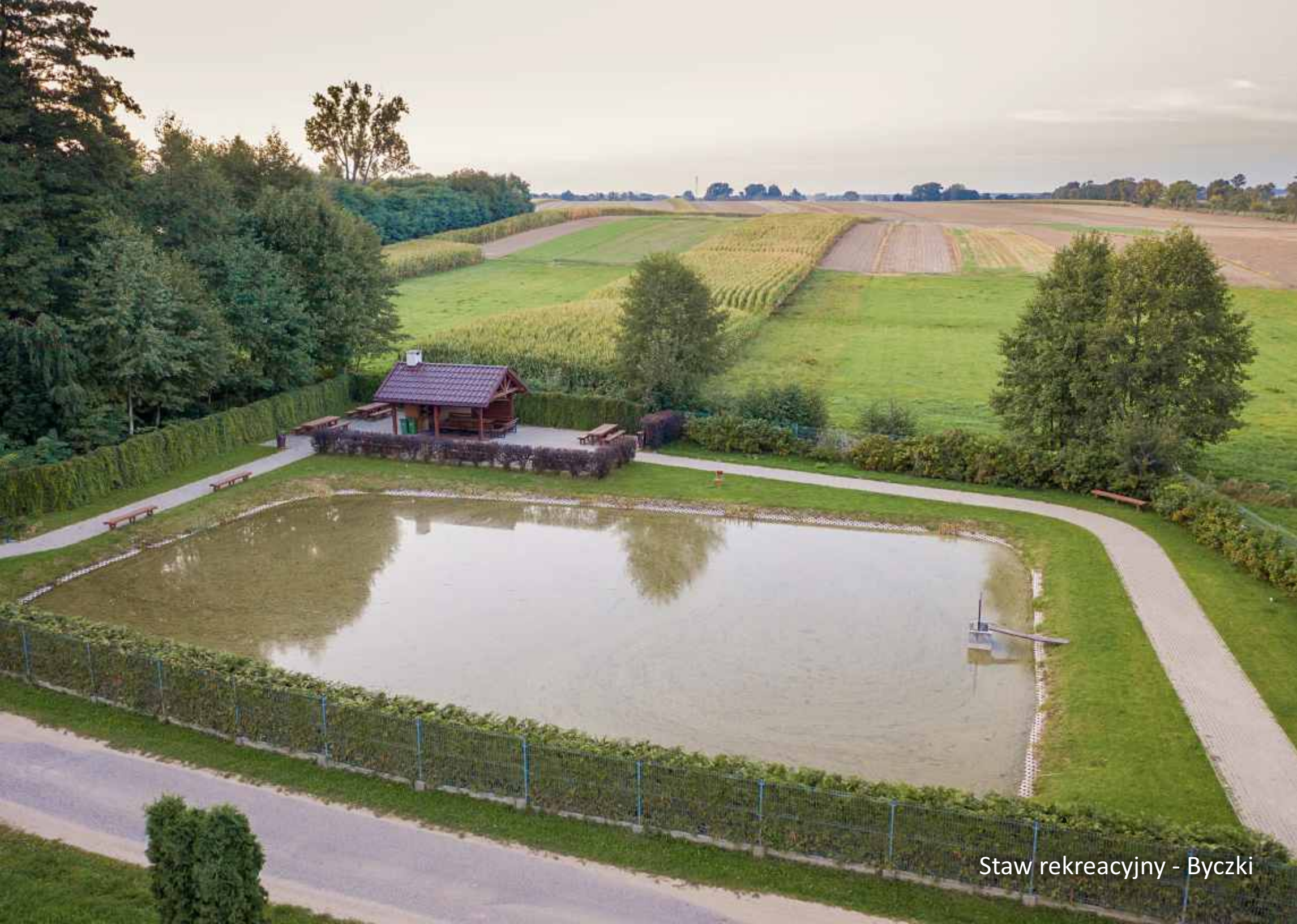
Staw rekreacyjny - Byczki