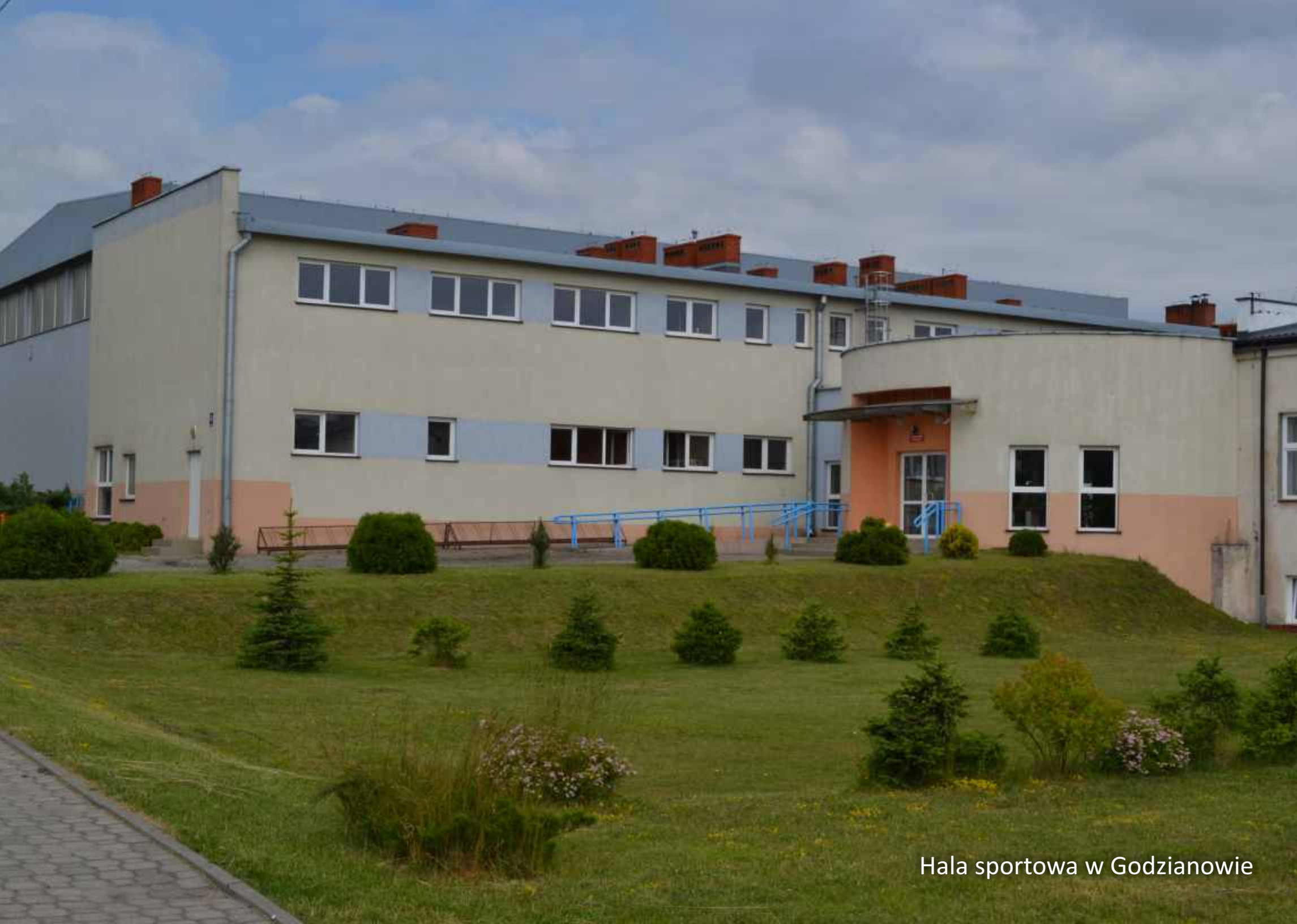
Hala sportowa w Godzianowie