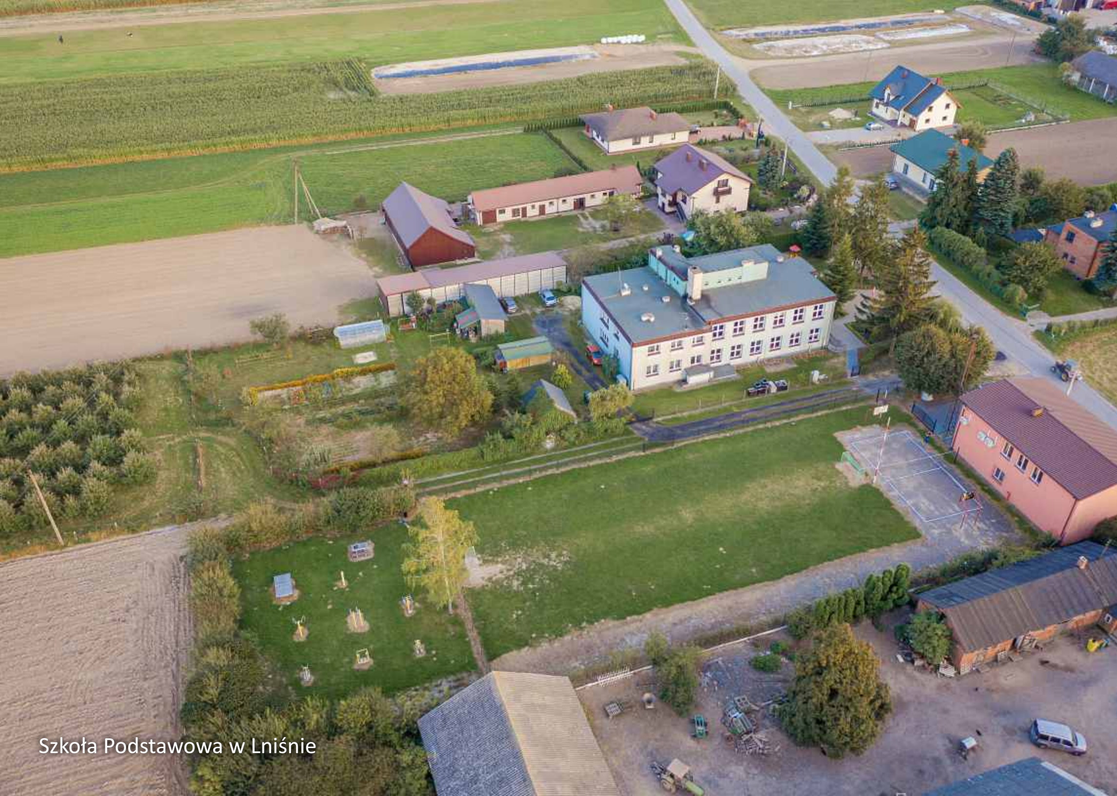
Szkoła Podstawowa w Lniście