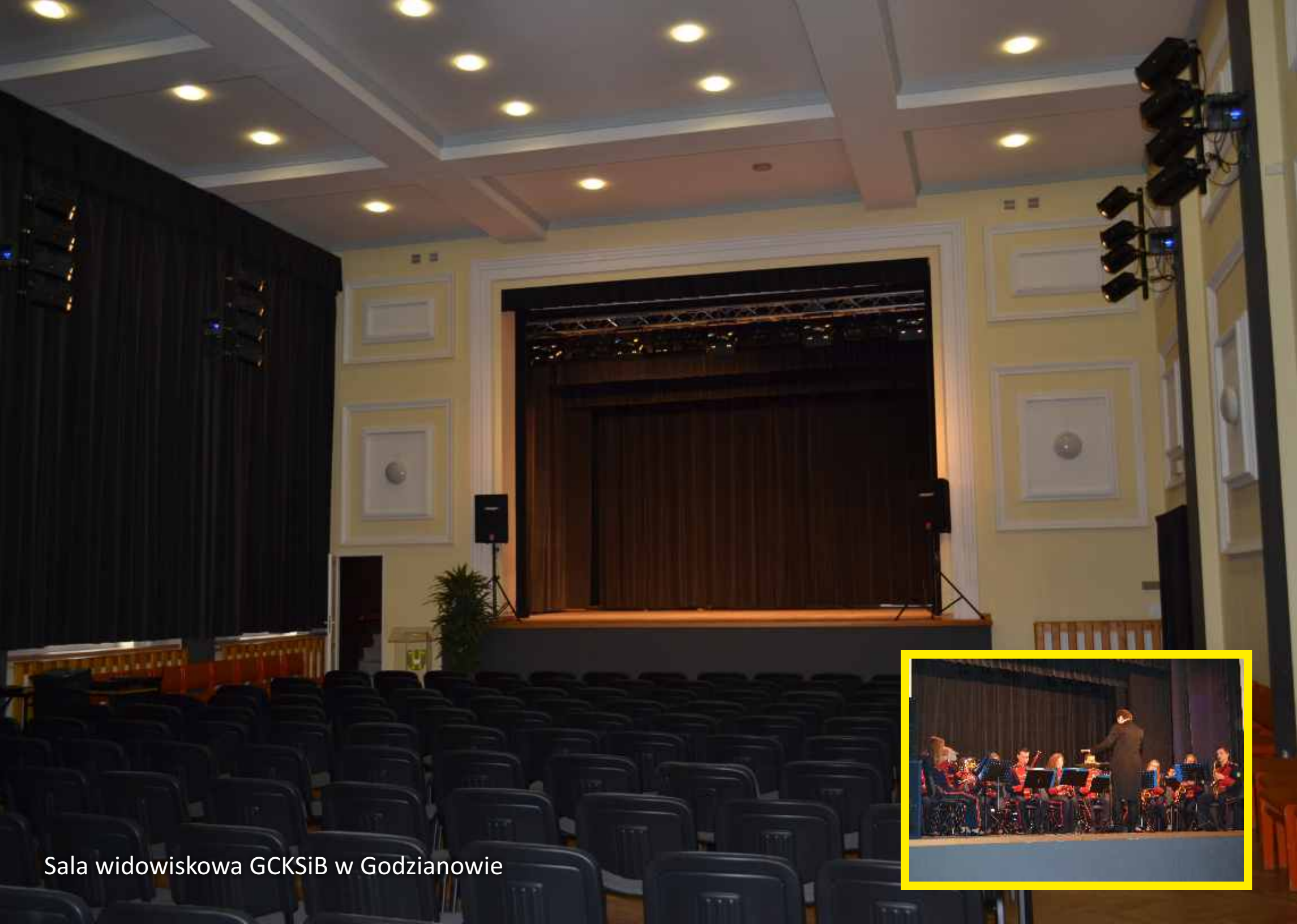
Sala widowiskowa GCKSiB w Godzianowie