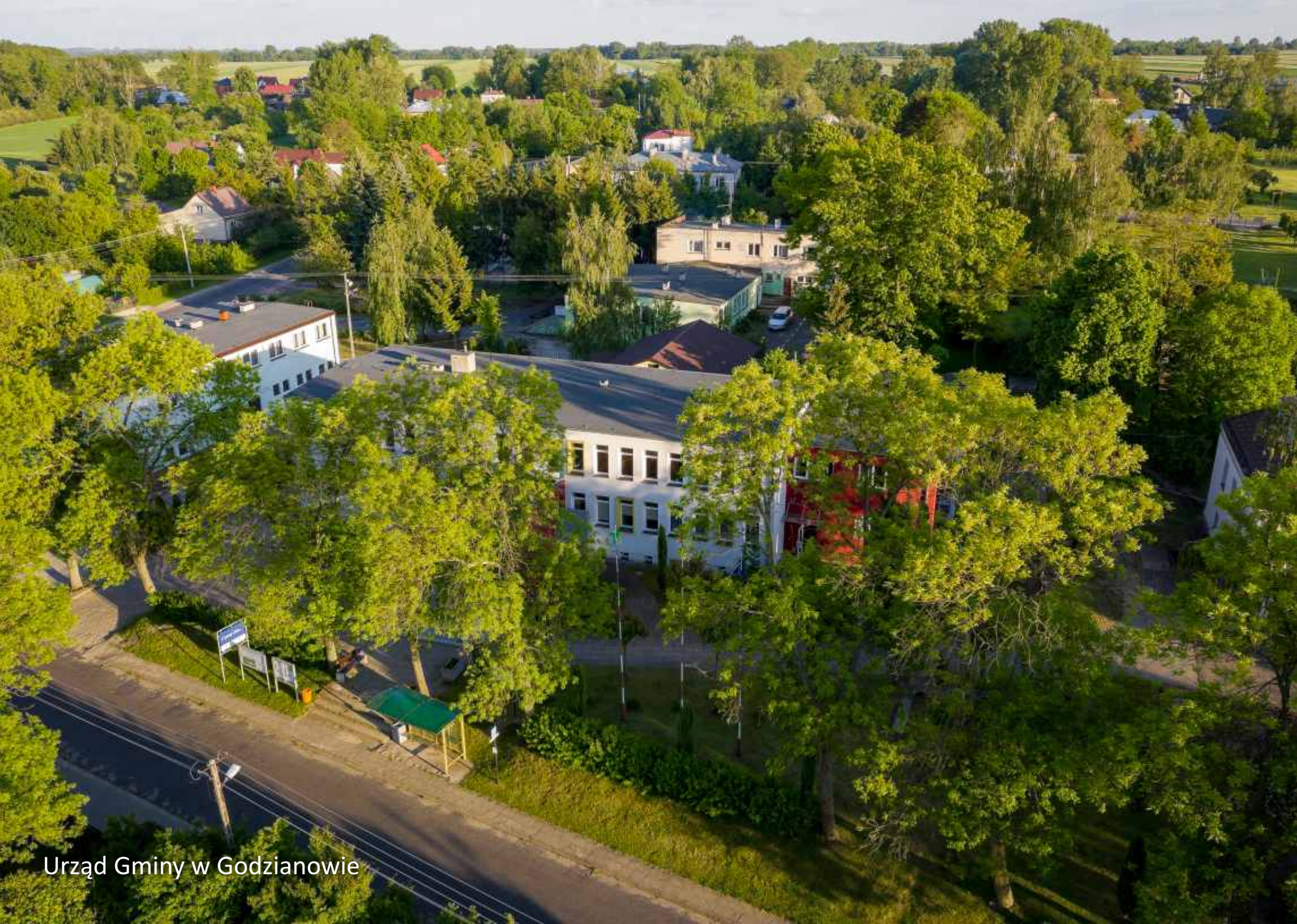
Urząd Gminy w Godzianowie