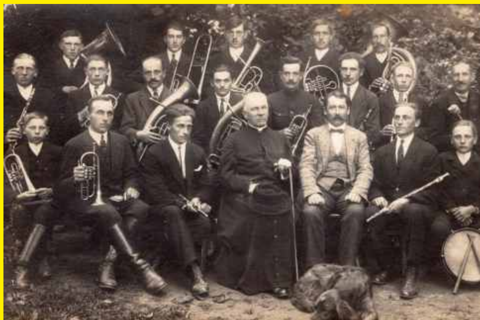
Godzianowska Orkiestra Dęta rok 1912