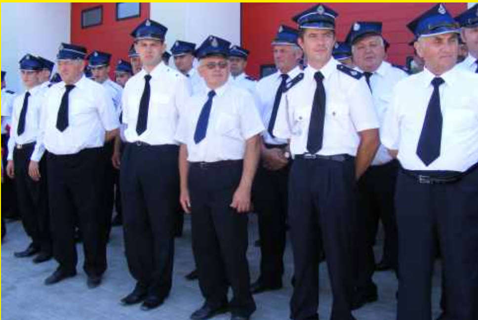
90 - lecie OSP Godzianów