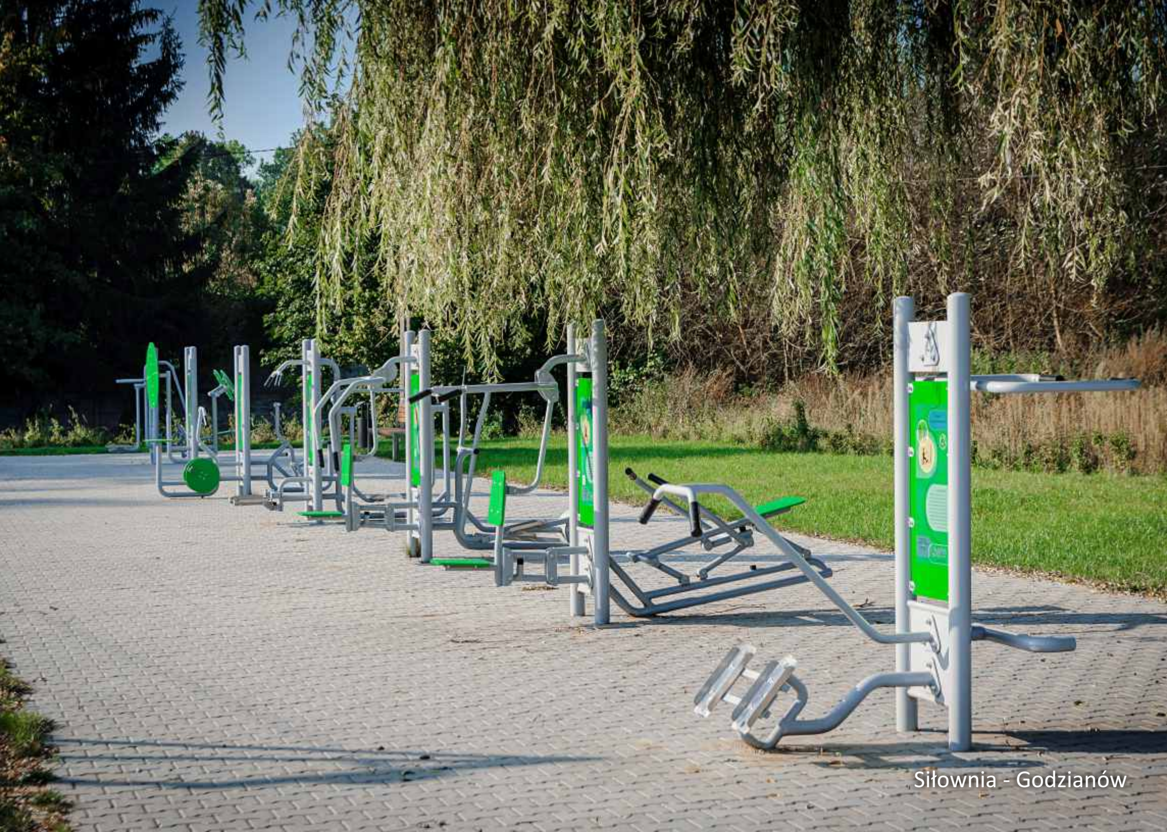
Siłownia - Godzianów