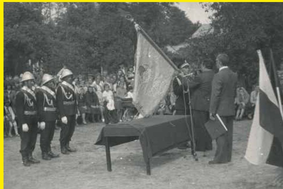
Przekazanie sztandaru OSP w Godzianowie 1978 rok