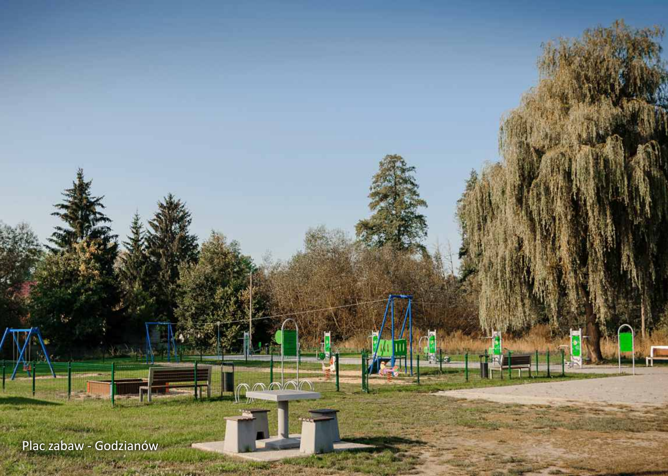
Plac zabaw - Godzianów