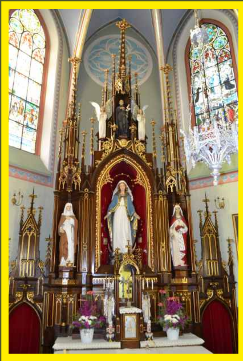
Ołtarz w kościele parafialnym w Godzianowie