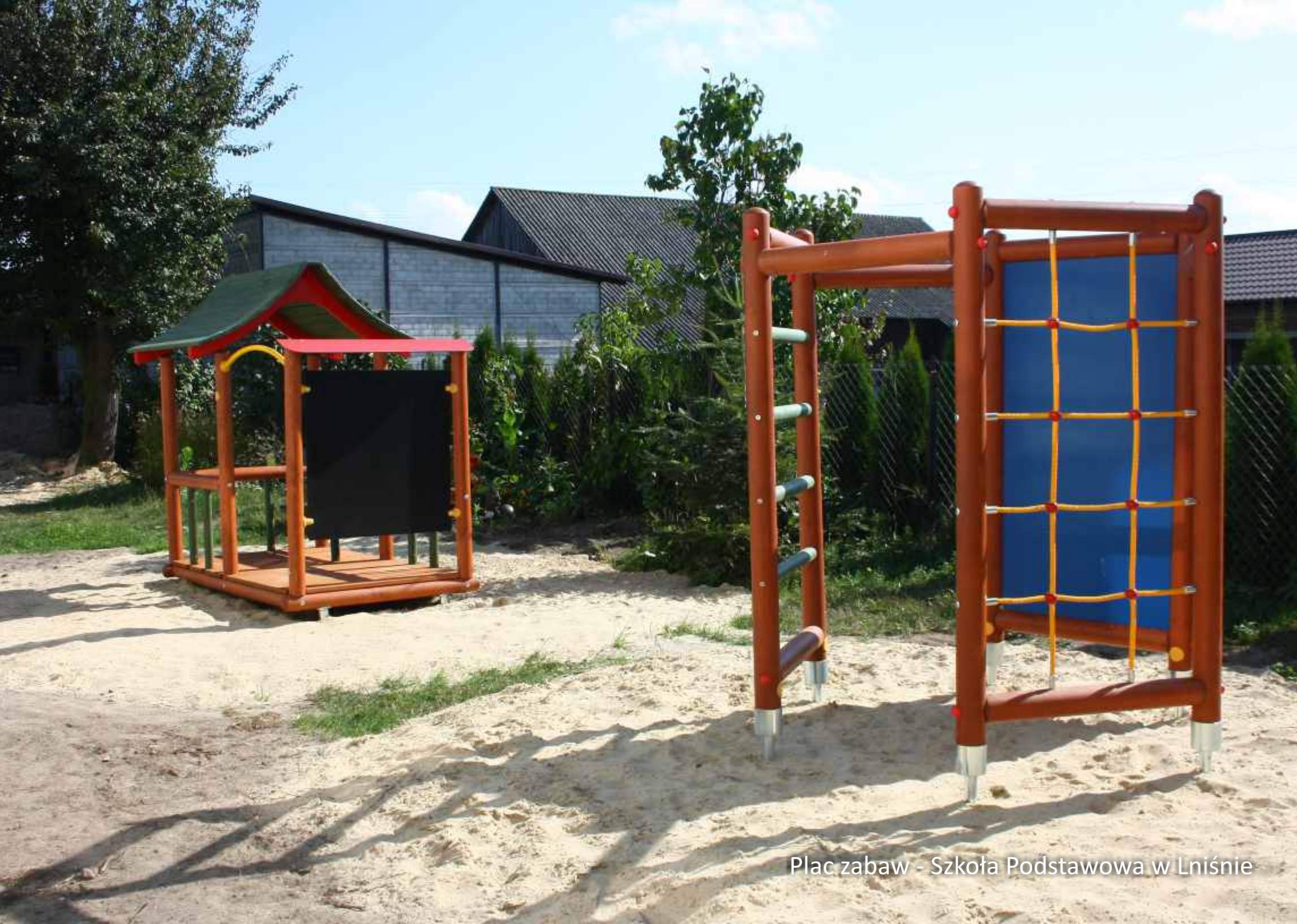
Plac zabaw - Szkoła Podstawowa w Lniśnie