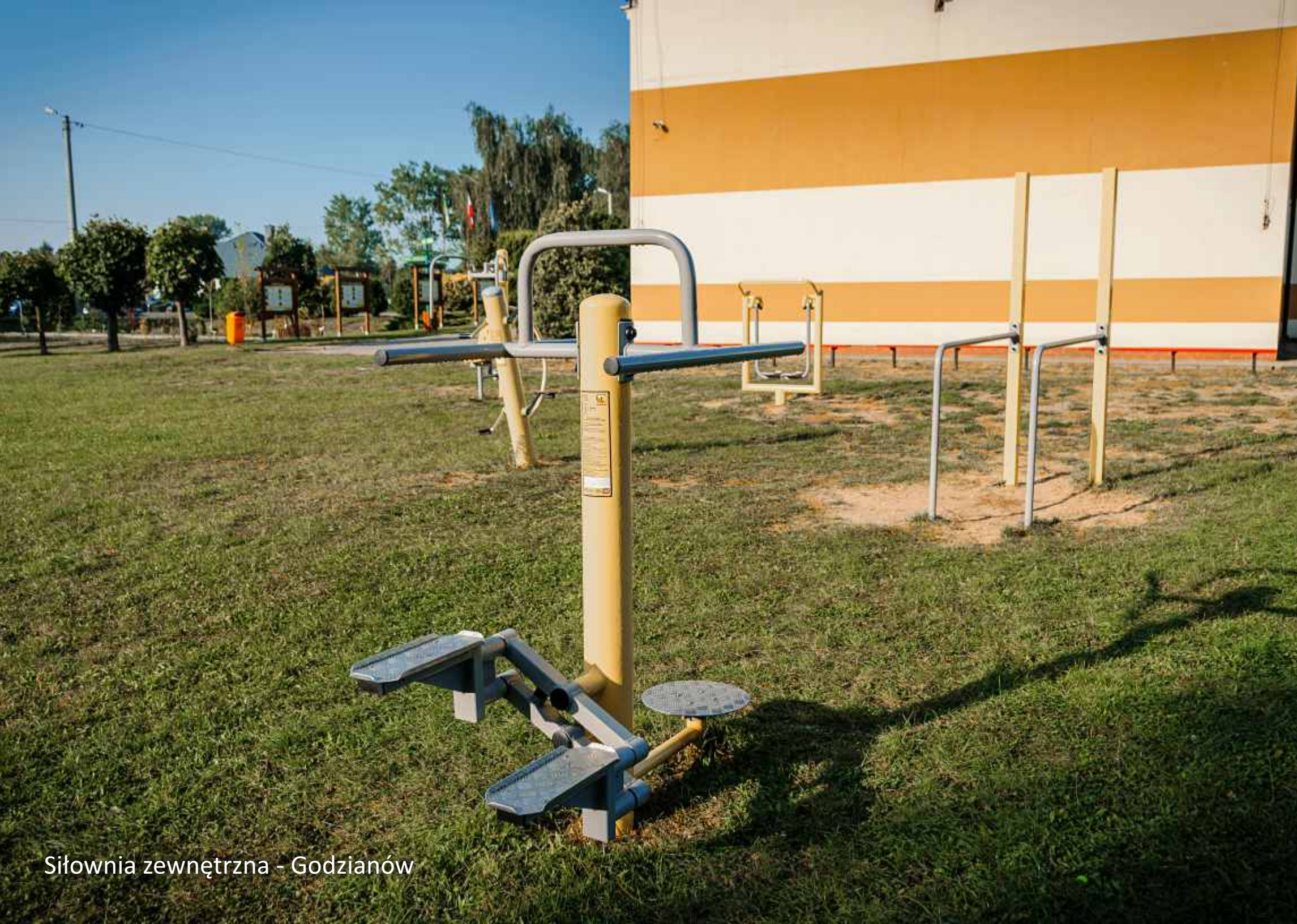
Siłownia zewnętrzna - Godzianów