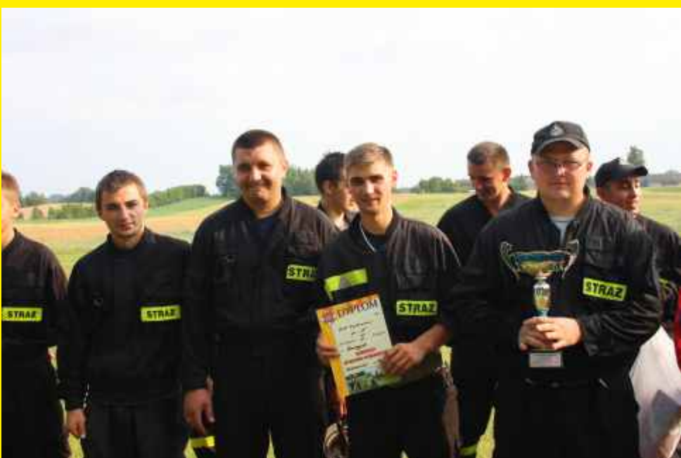
Druhowie OSP-Godzianów - zawody pożarnicze