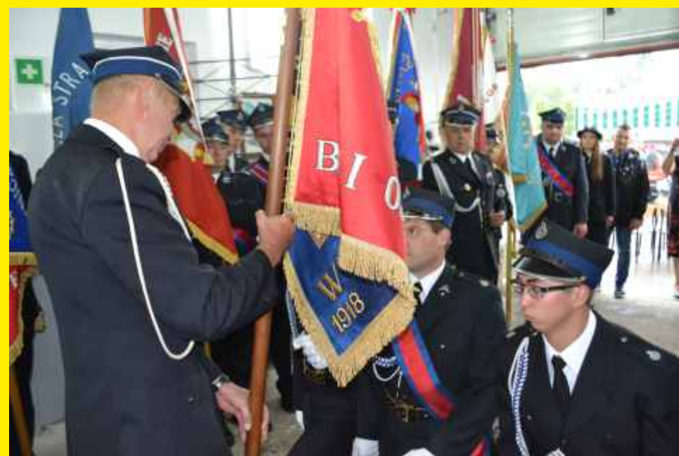
Przekazanie sztandaru OSP w Godzianowie 2018