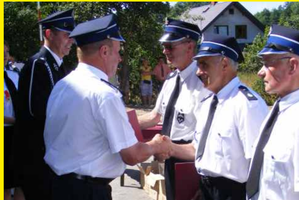
90 - lecie OSP Godzianów