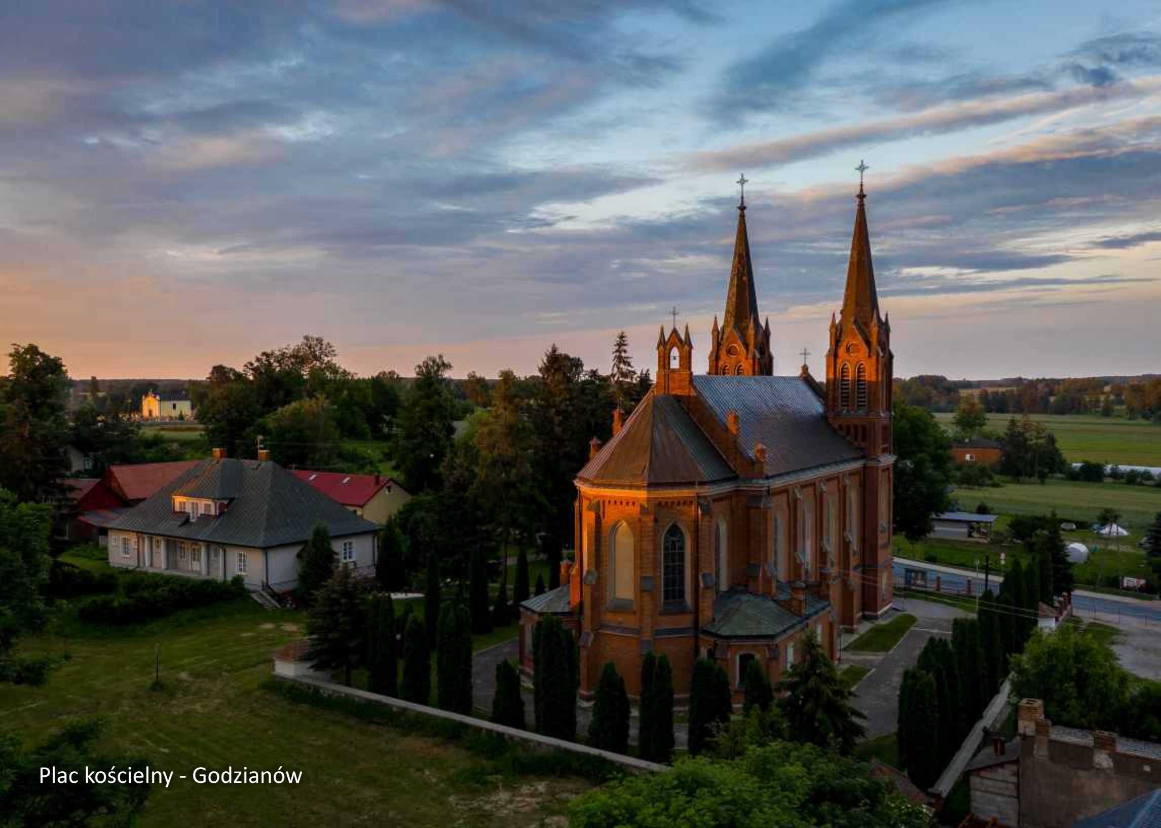
Plac kościelny - Godzianów