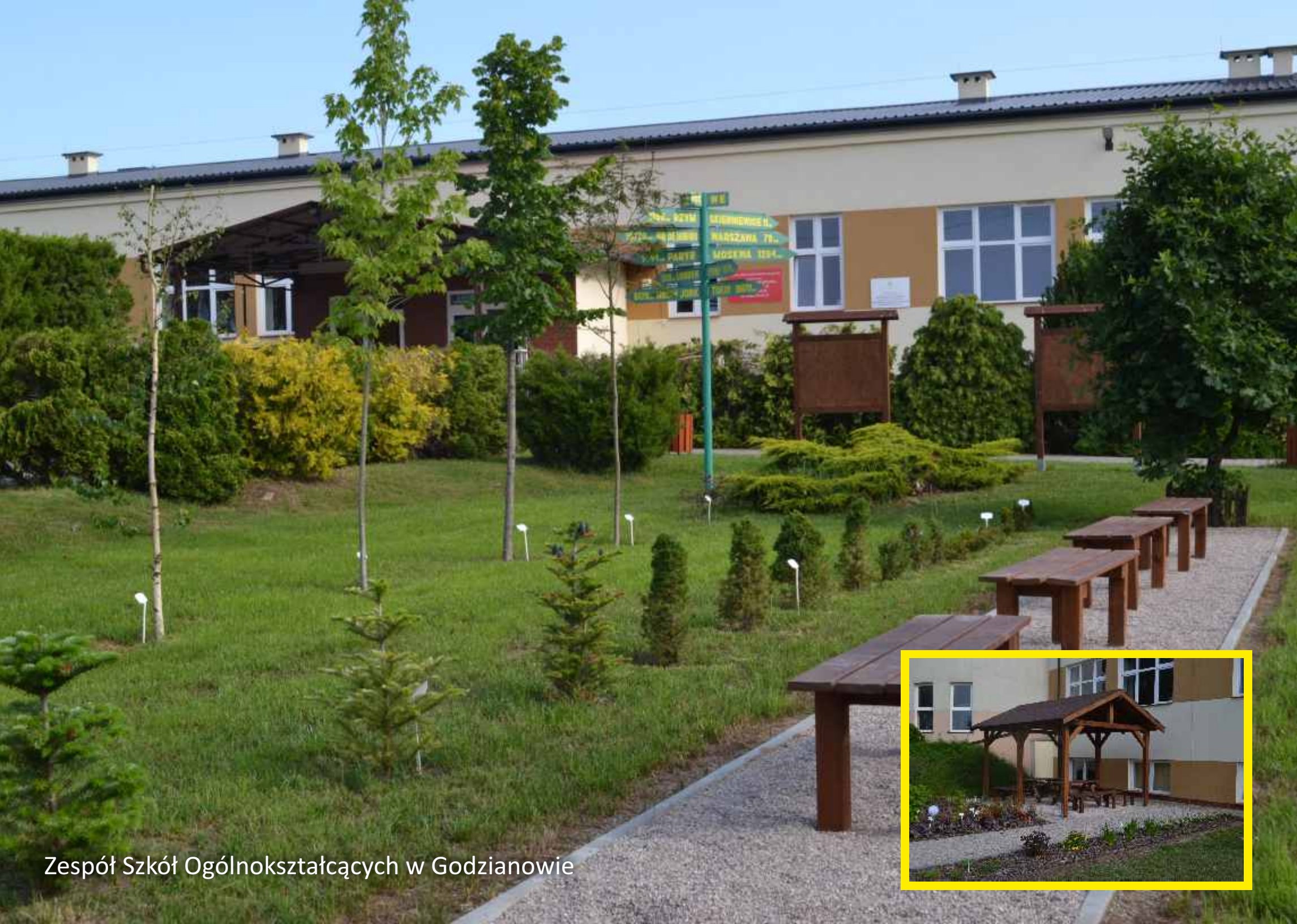
Zespół Szkół Ogólnokształcących w Godzianowie