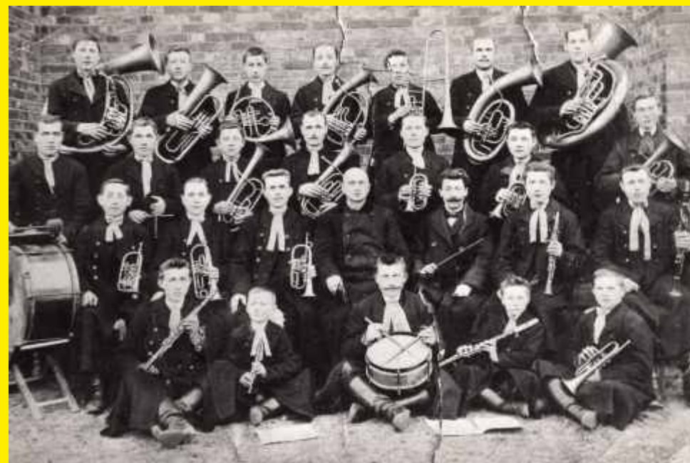
Godzianowska Orkiestra Dęta rok 1926