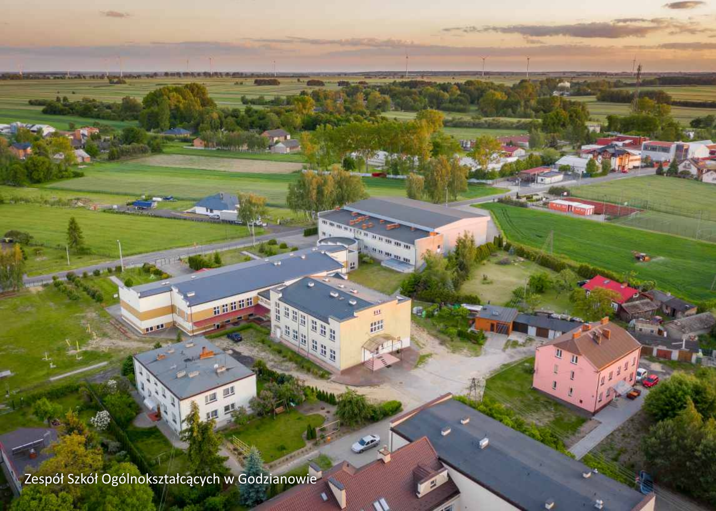
Zespół Szkół Ogólnokształcących w Godzianowie