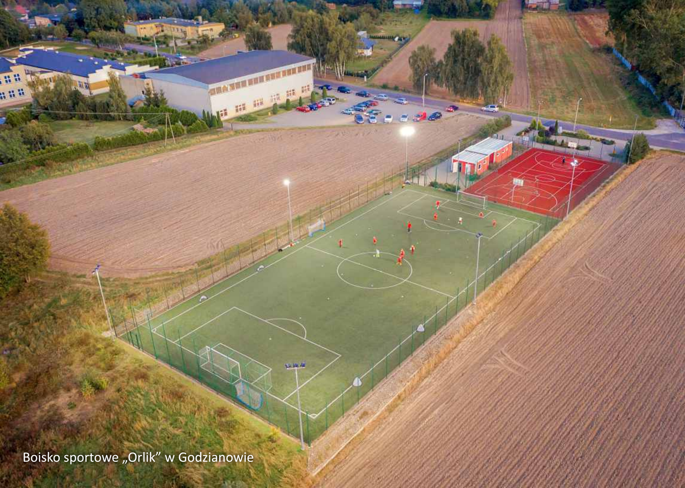
Boisko sportowe „Orlik” w Godzianowie