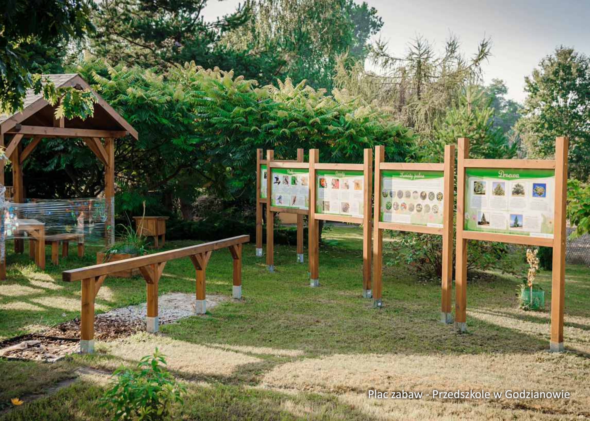
Plac zabaw - Przedszkole w Godzianowie