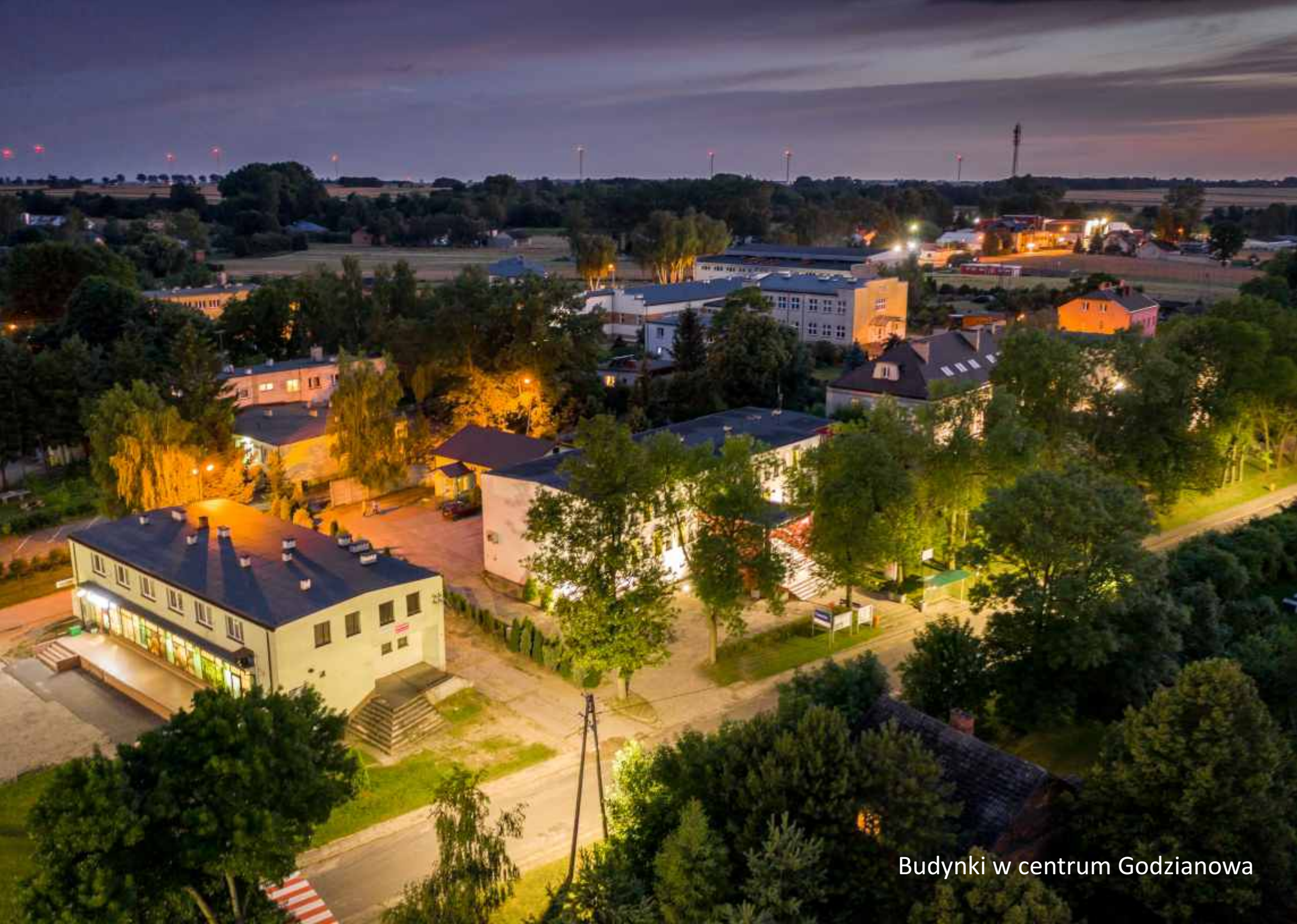
Budynki w centrum Godzianowa