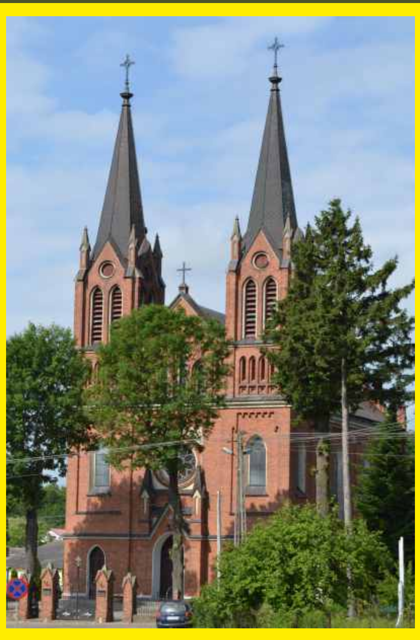
Kościół p.w. św. Stanisława