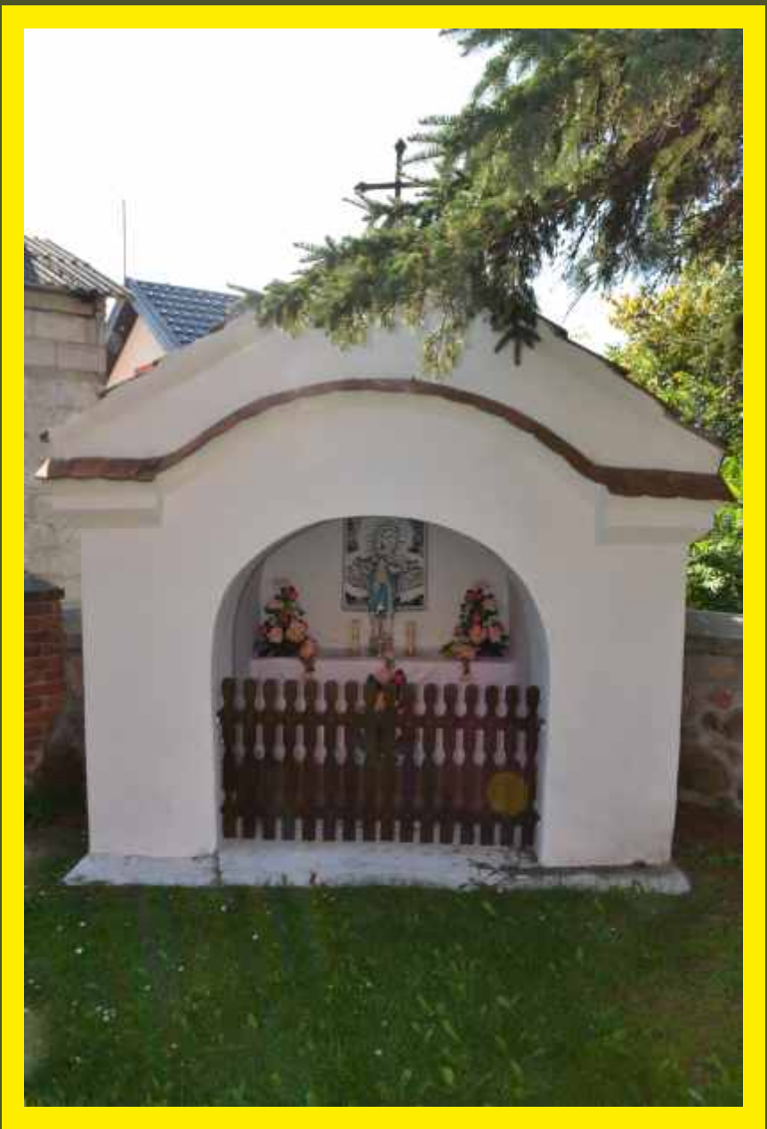
Kapliczki przy kościele parafialnym w Godzianowie