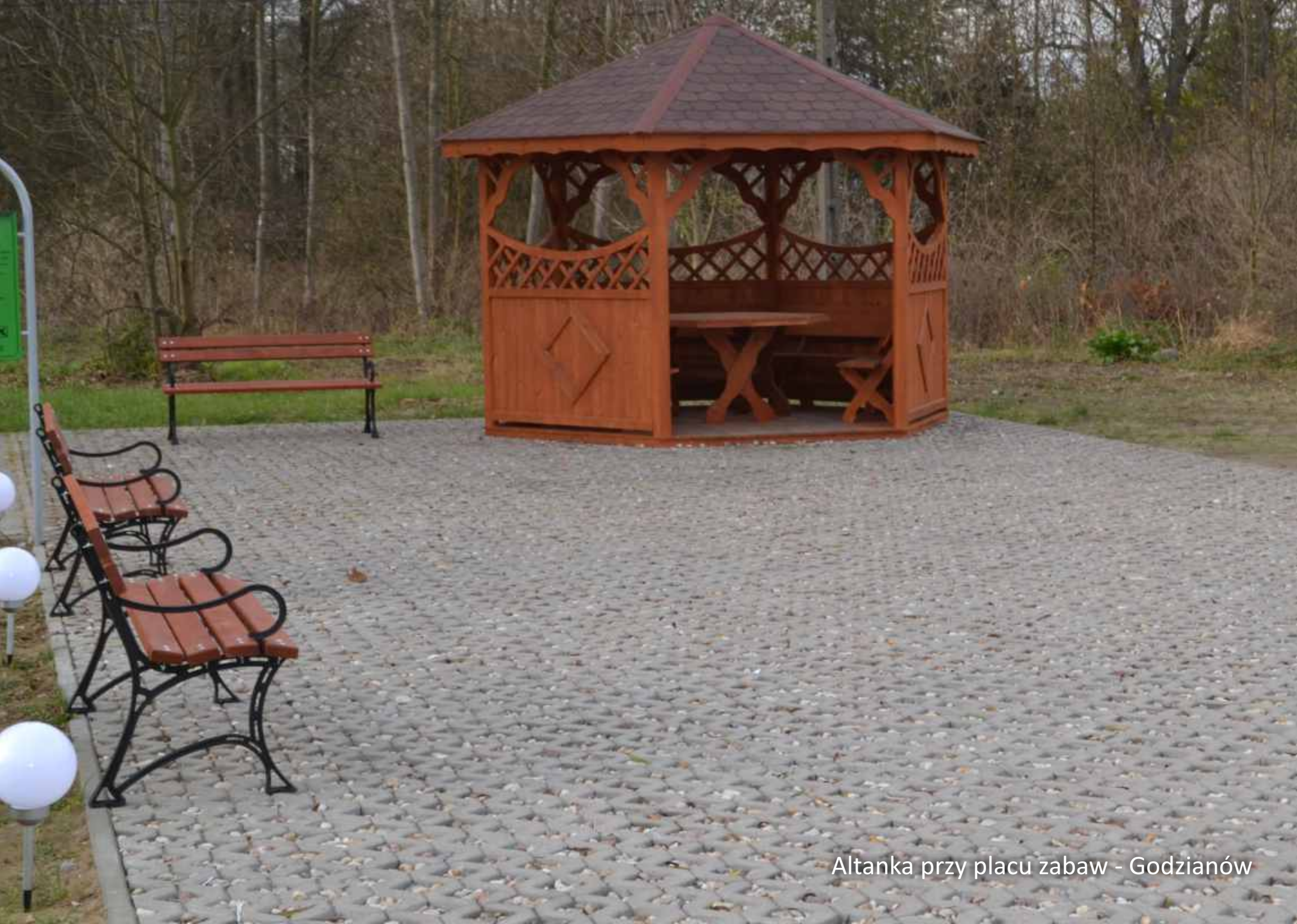
Altanka przy placu zabaw - Godzianów