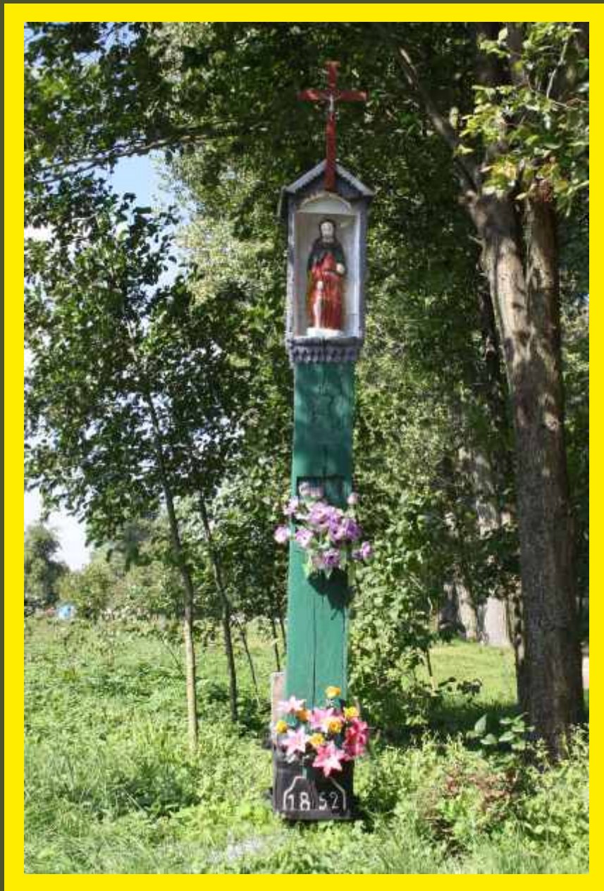
Kapliczka Św Rocha - Zapady