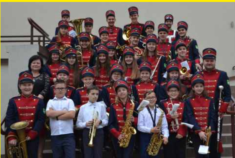
Młodzieżowa Orkiestra Dęta Gminy Godzianów