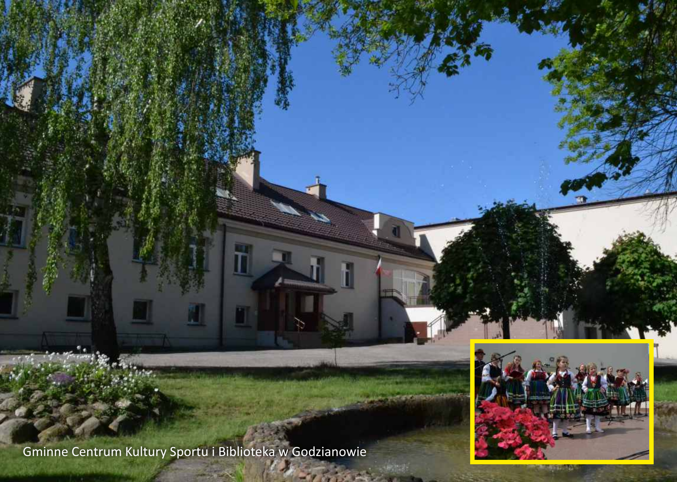
Gminne Centrum Kultury Sportu i Biblioteka w Godzianowie