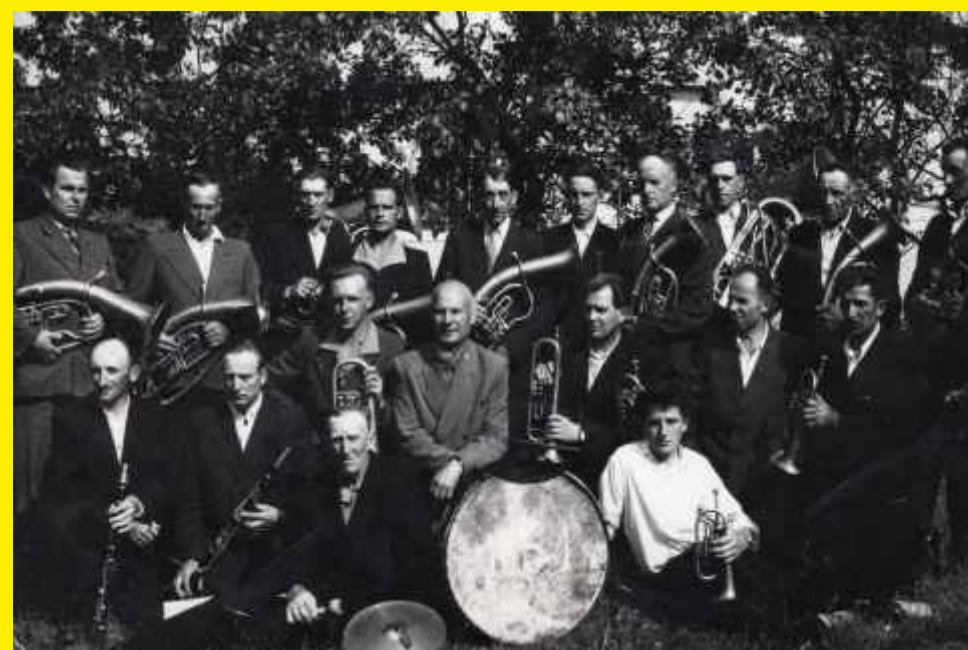
Godzianowska Orkiestra Dęta rok 1960