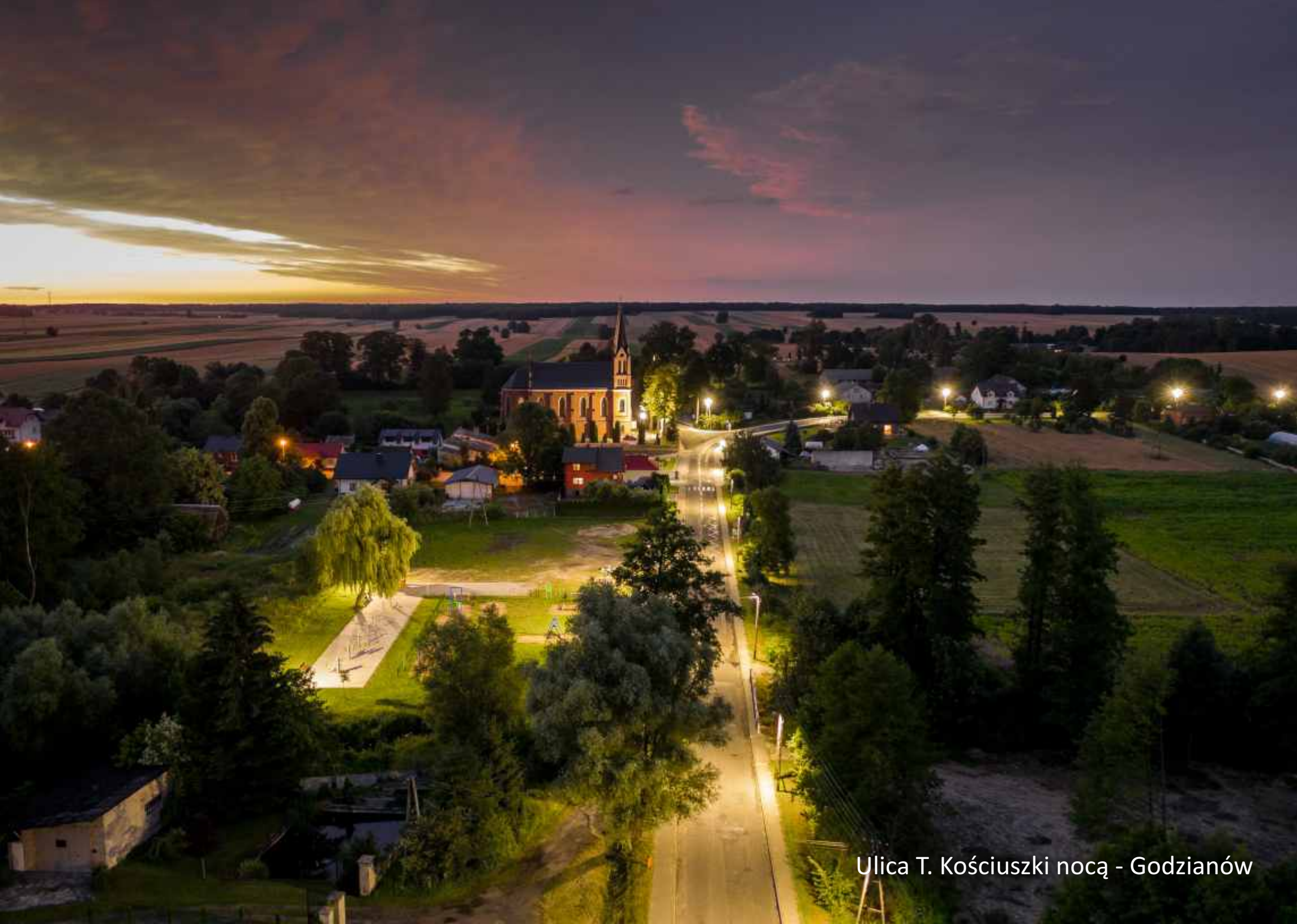
Ulica T. Kościuszki nocą - Godzianów