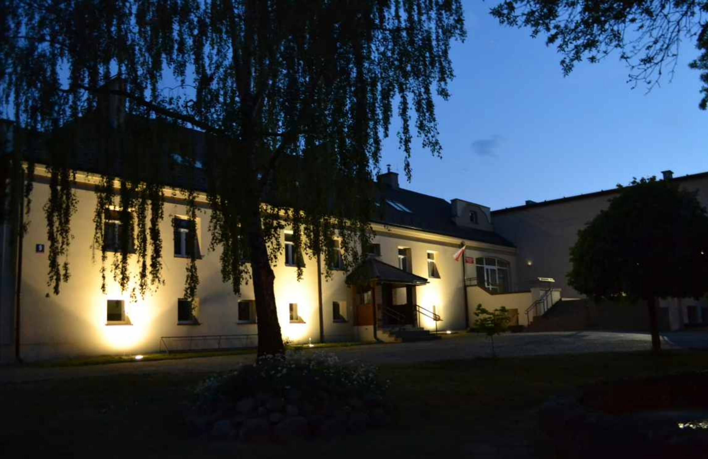
Gminne Centrum Kultury Sportu i Biblioteka w Godzianowie