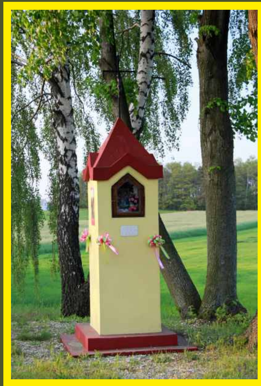
Kapliczka na granicy Godzianów/Płyćwia