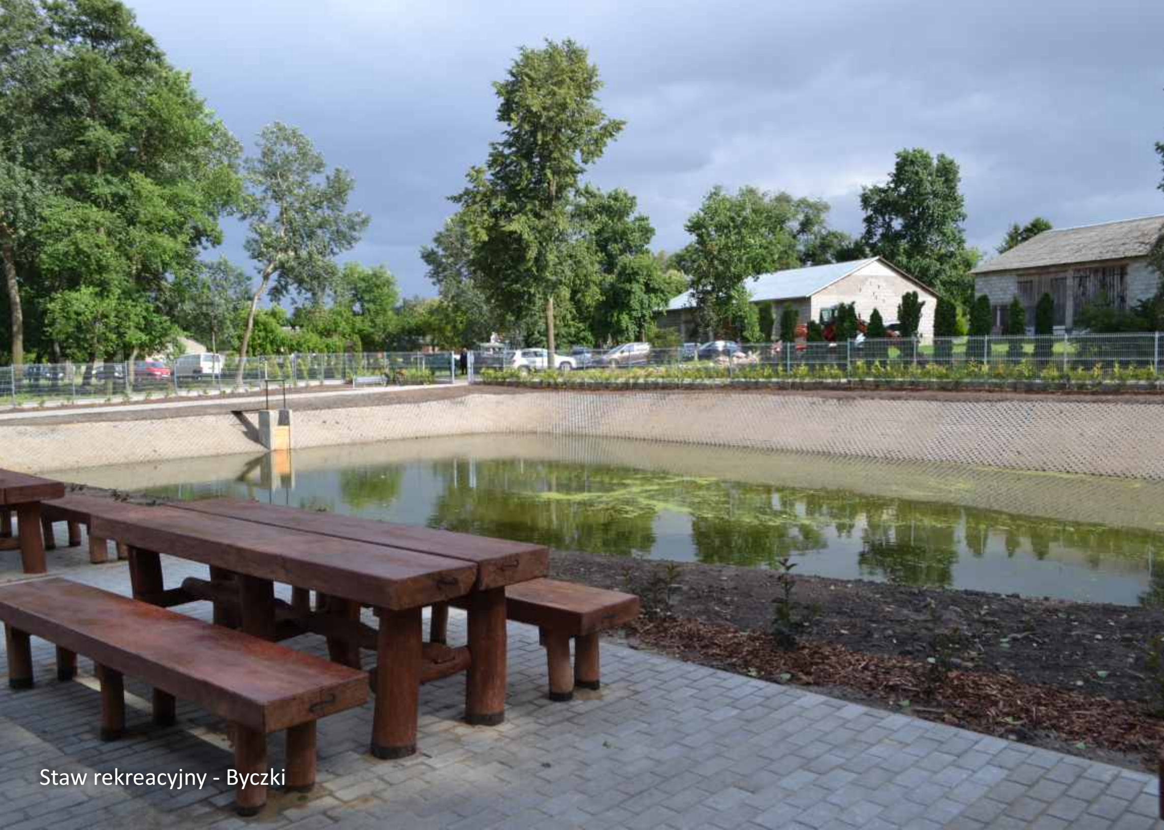
Staw rekreacyjny - Byczki