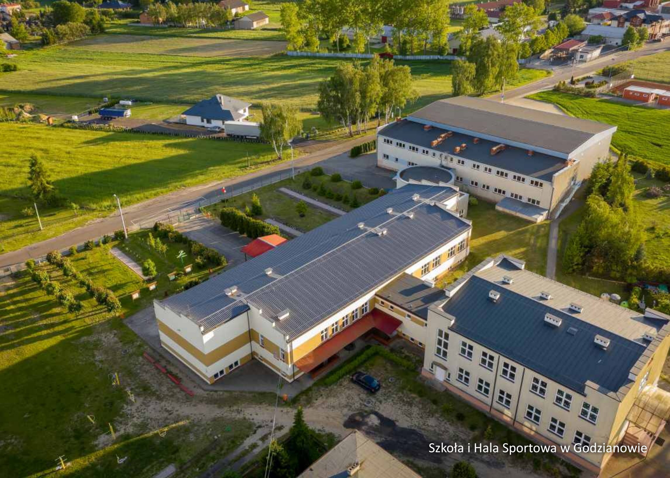
Szkoła i Hala Sportowa w Godzianowie