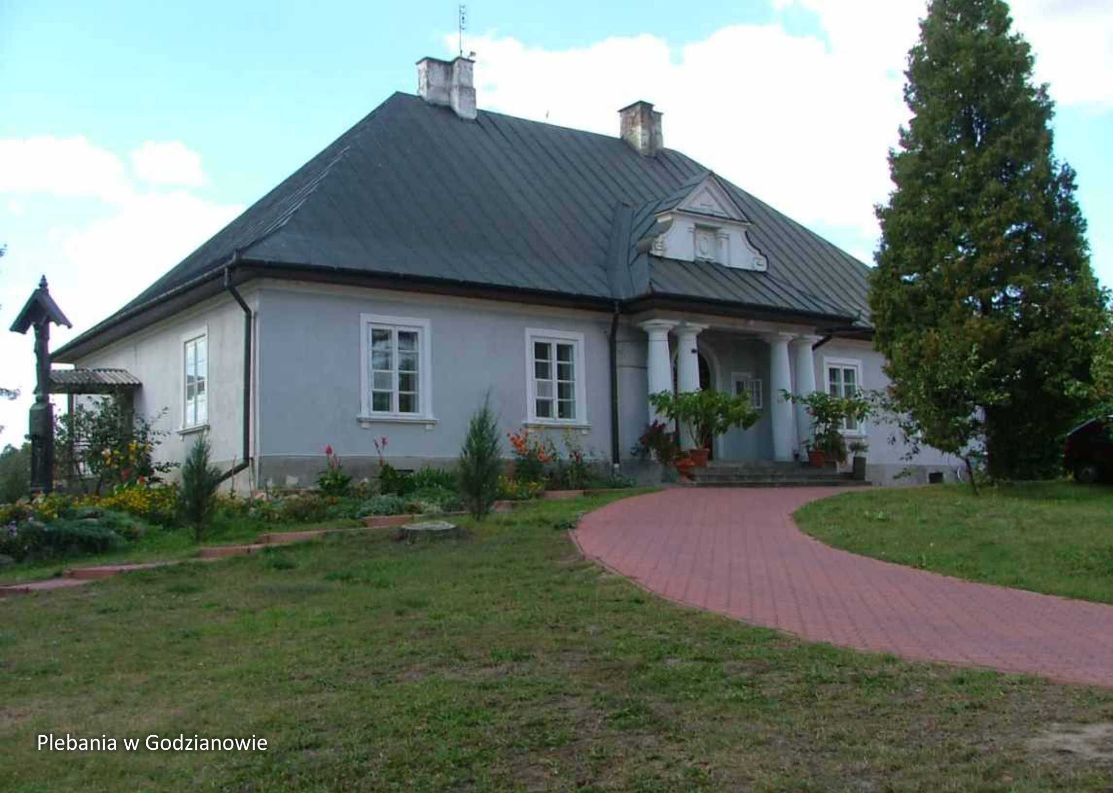
Plebania w Godzianowie