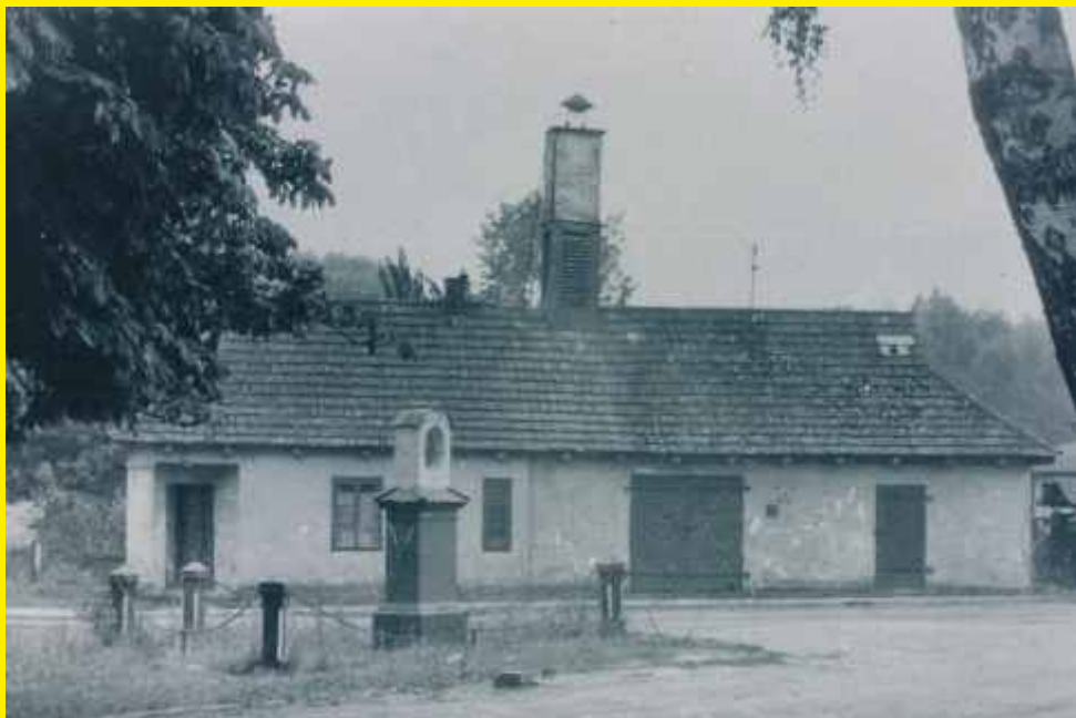
Pierwsza remiza OSP Godzianów