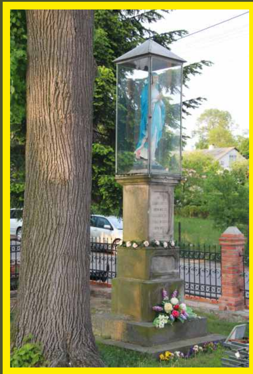
Kapliczka w Godzianowie