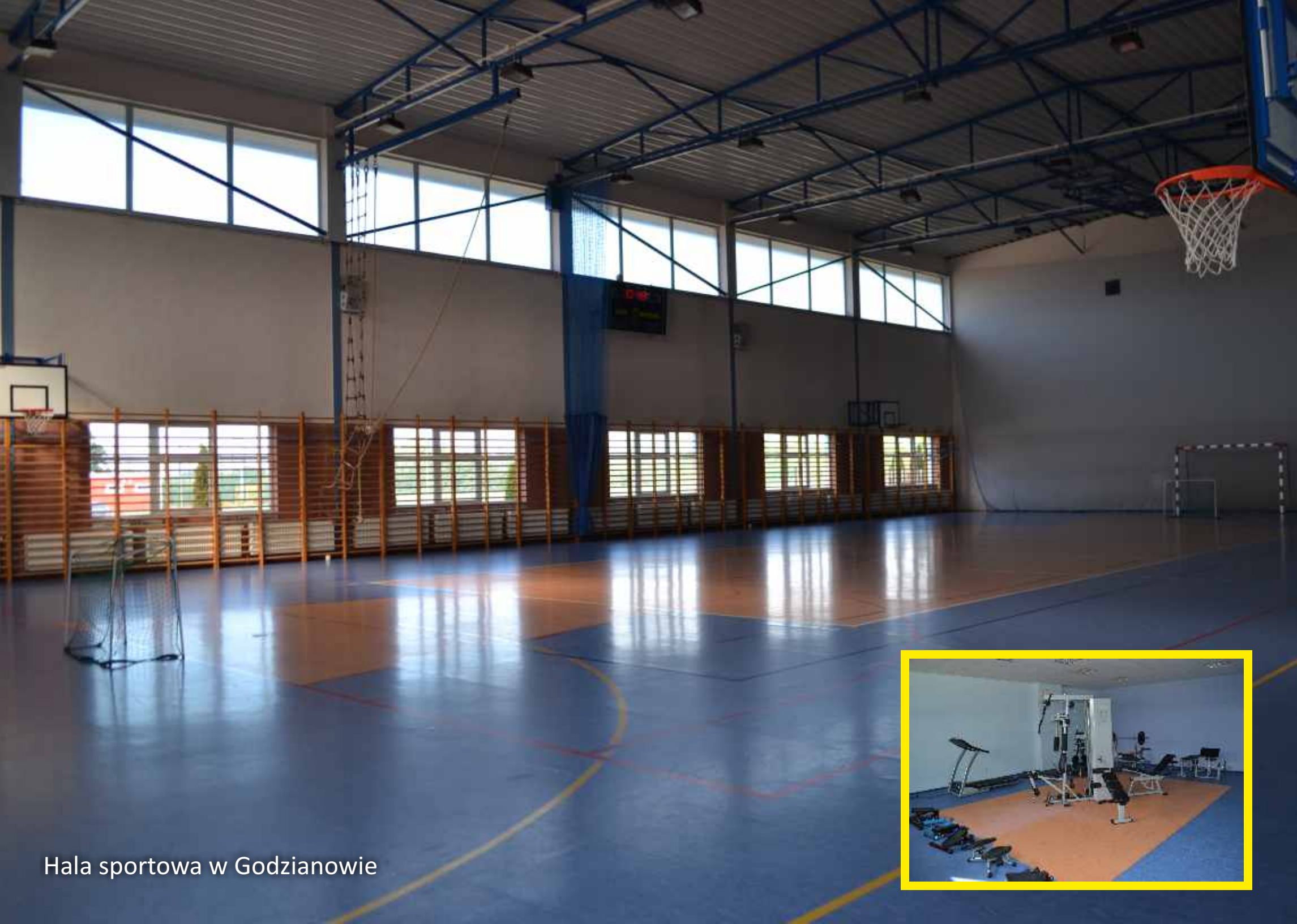
Hala sportowa w Godzianowie