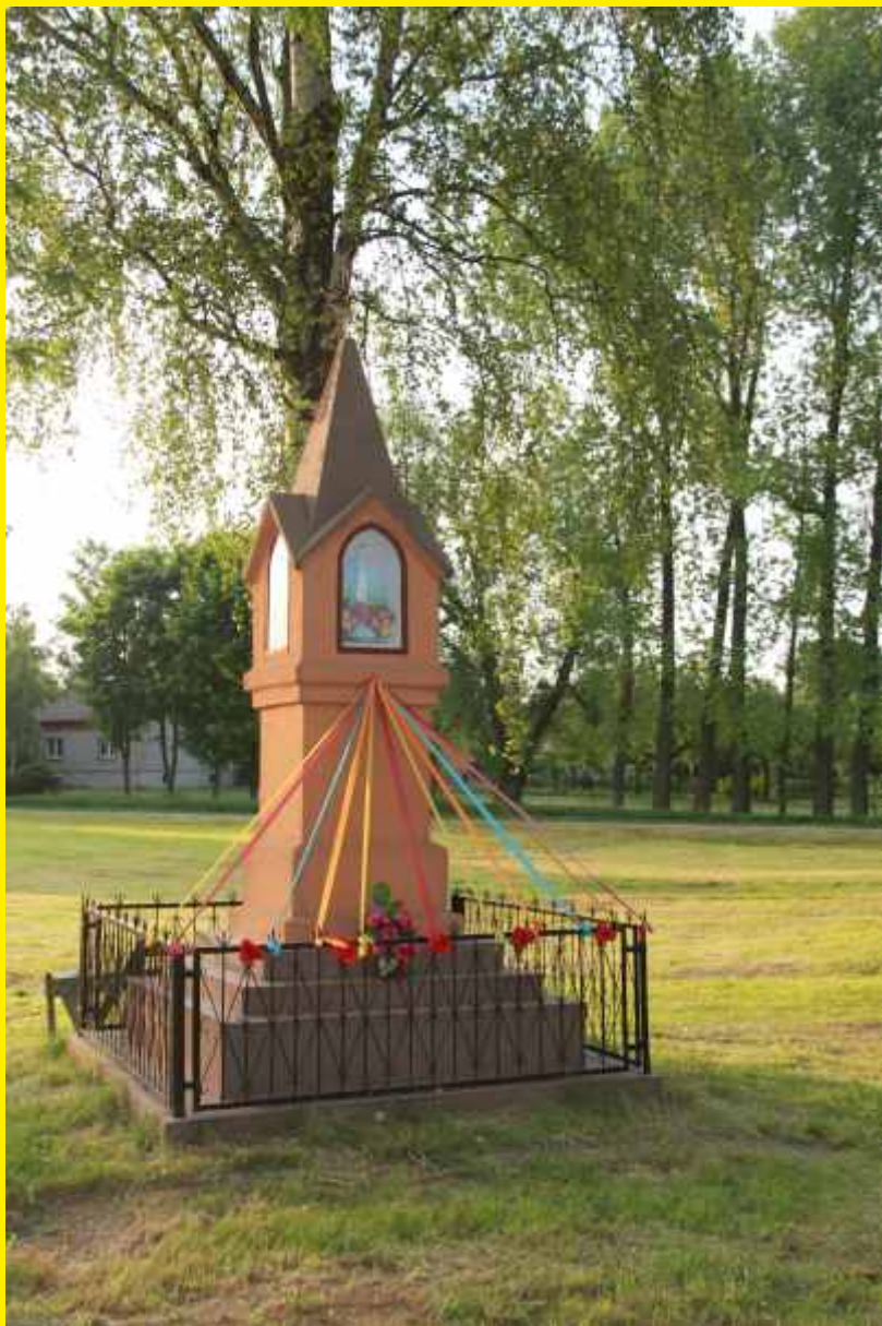
Kapliczka w Byczkach