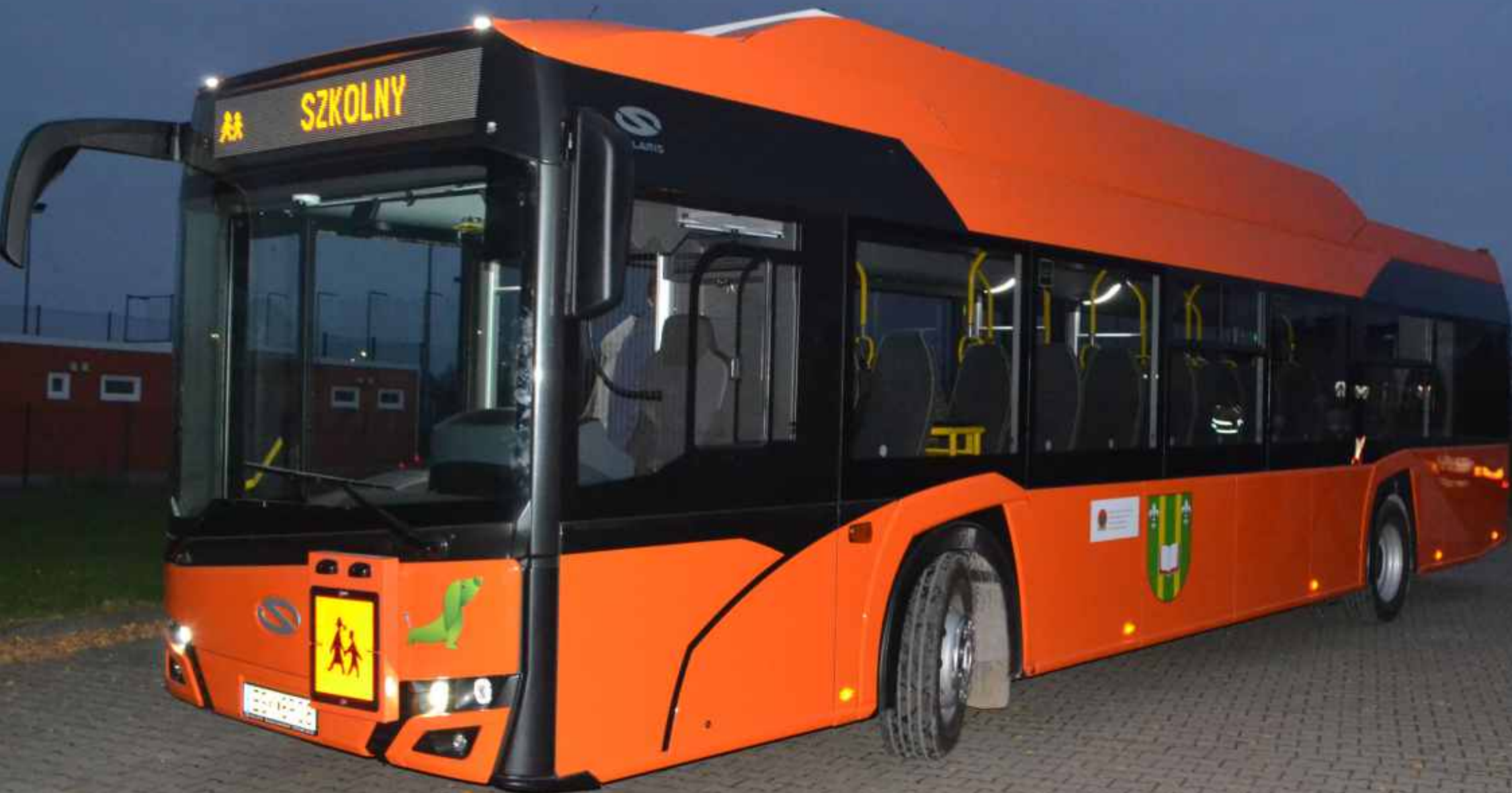
Elektryczny autobus szkolny w Godzianowie