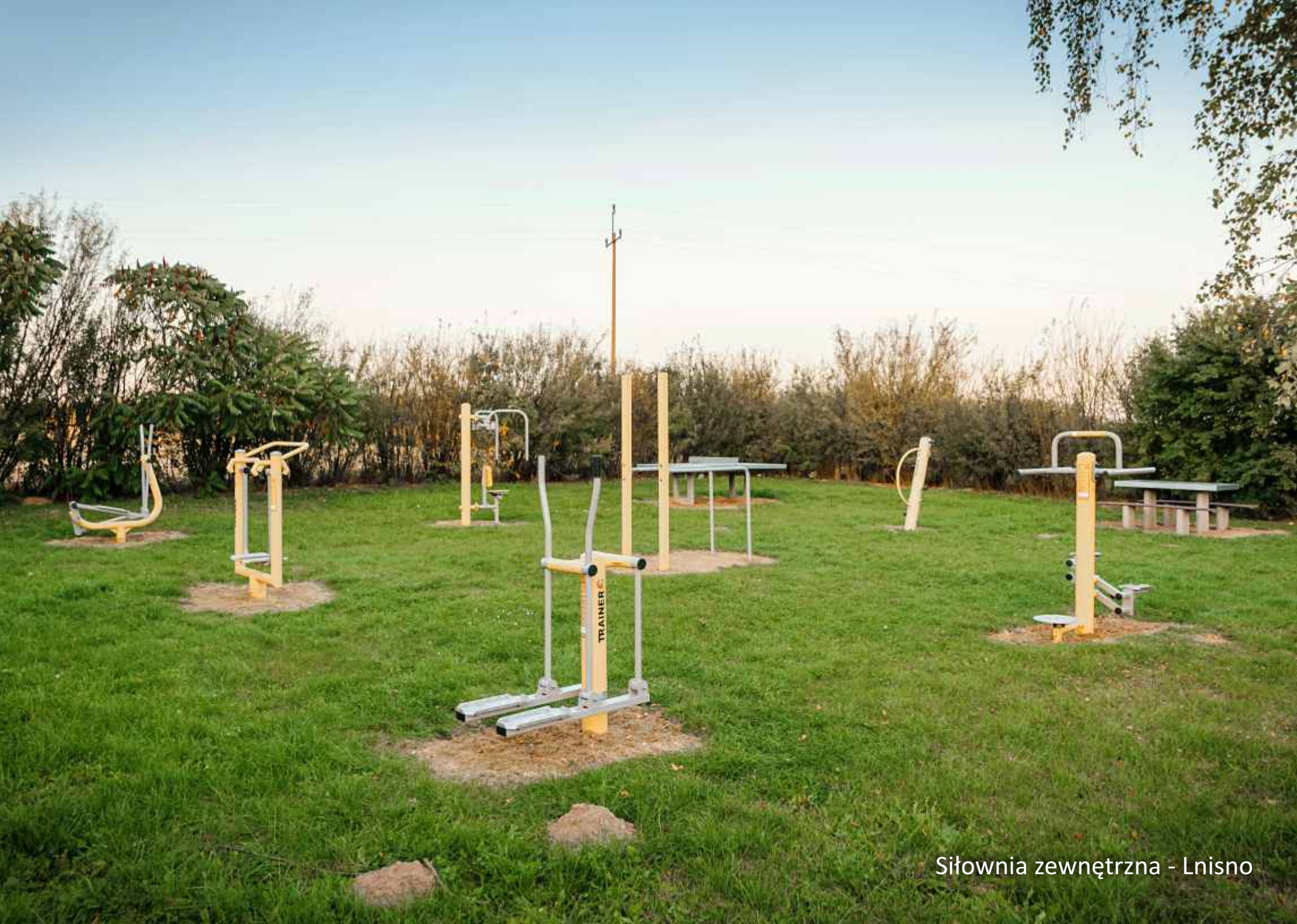
Siłownia zewnętrzna - Lnisno