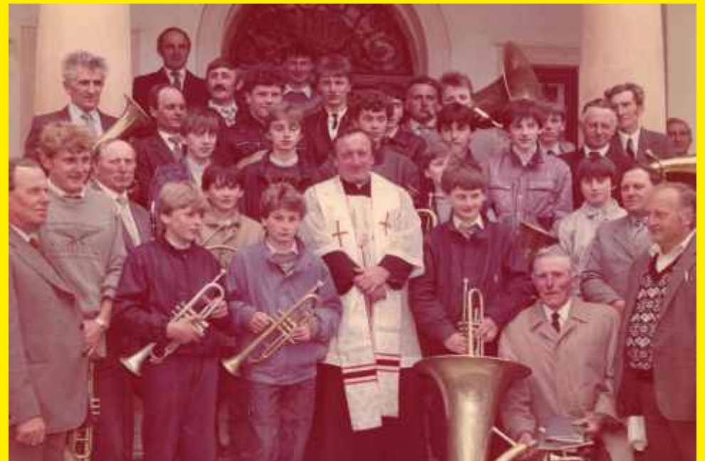
Godzianowska Orkiestra Dęta rok 1988