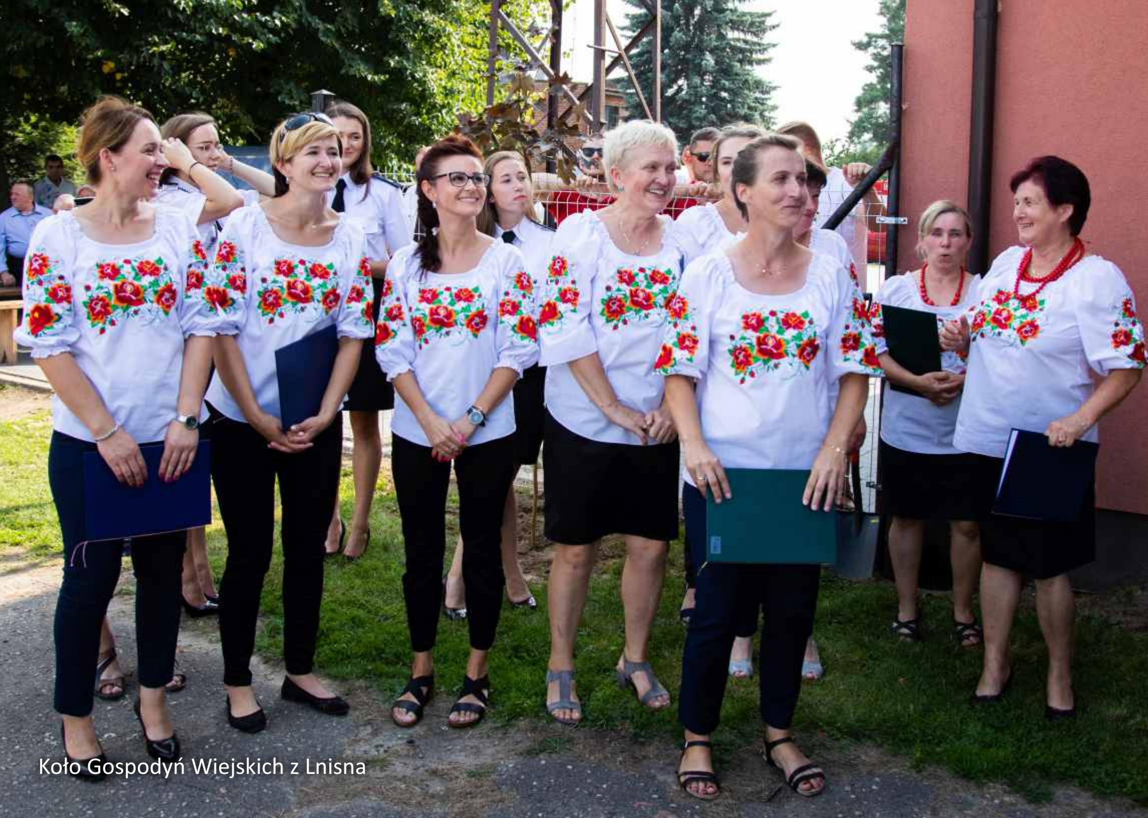
Koło Gospodyń Wiejskich z Lnisna