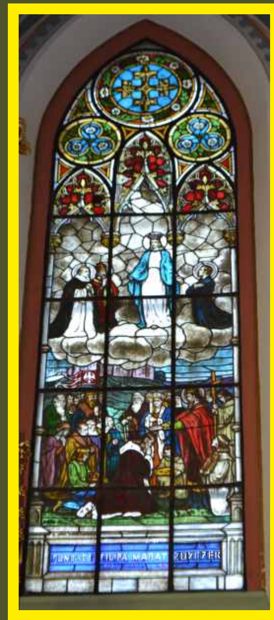
Zabytkowe witraże w kościele parafialnym w Godzianowie