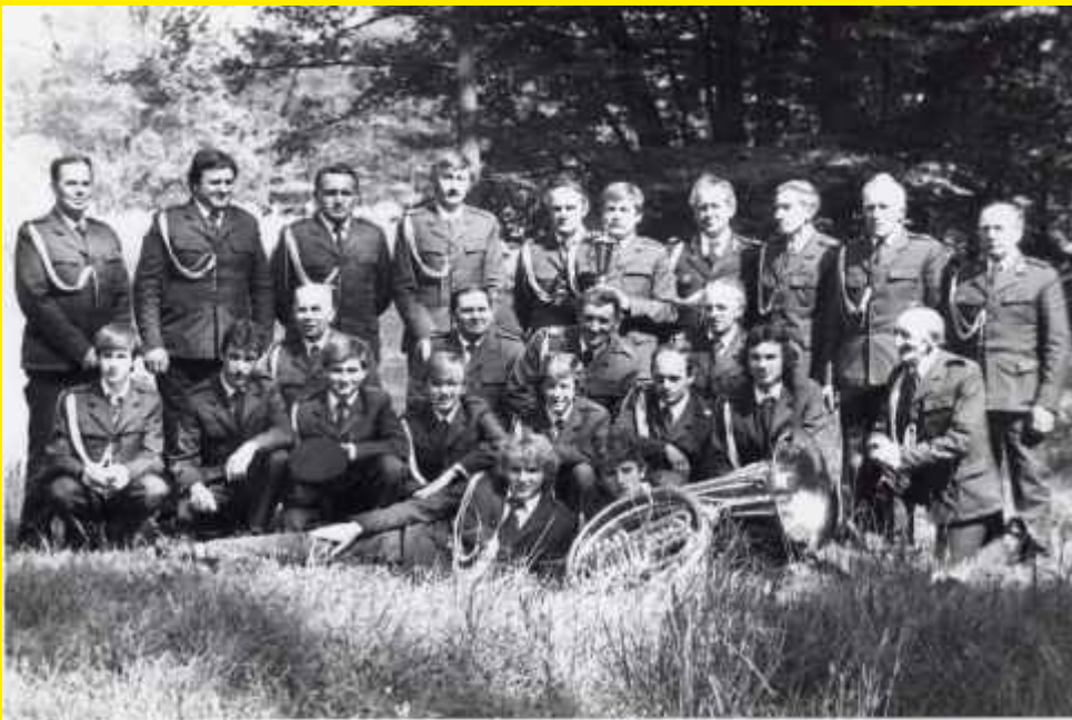
Godzianowska Orkiestra Dęta rok 1985