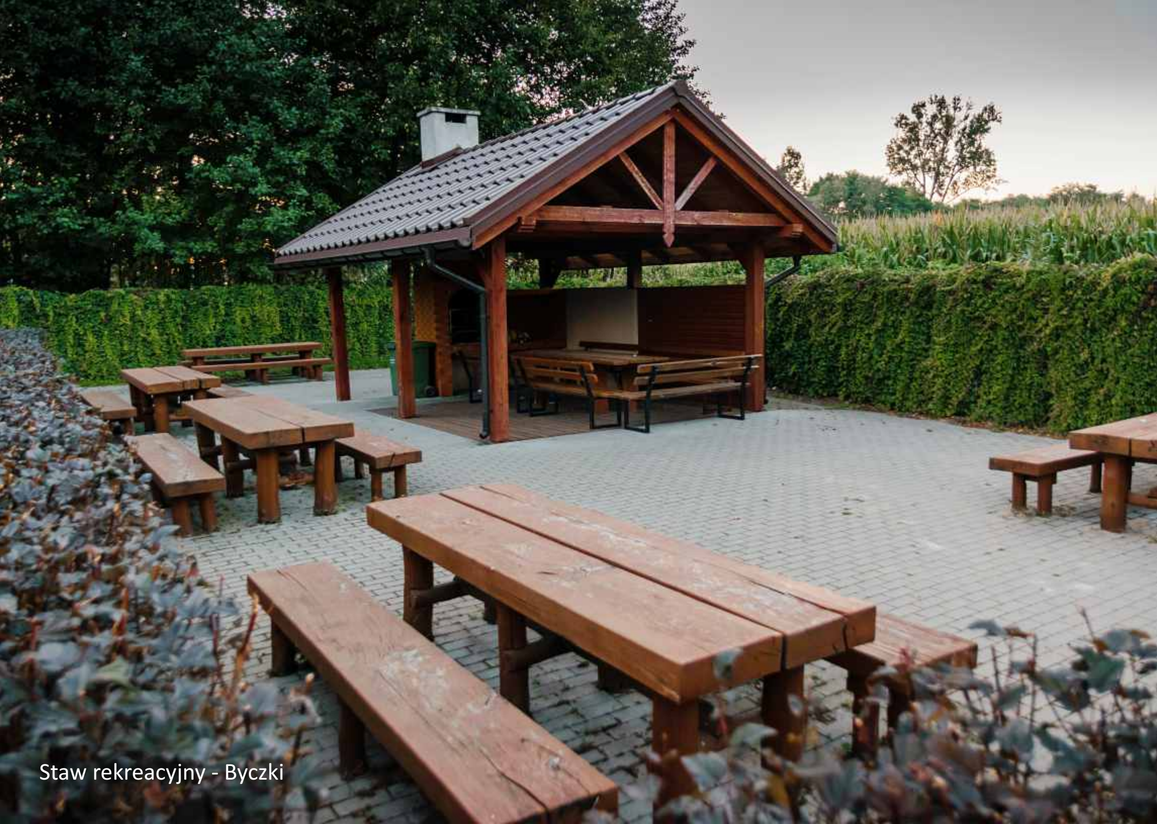
Staw rekreacyjny - Byczki