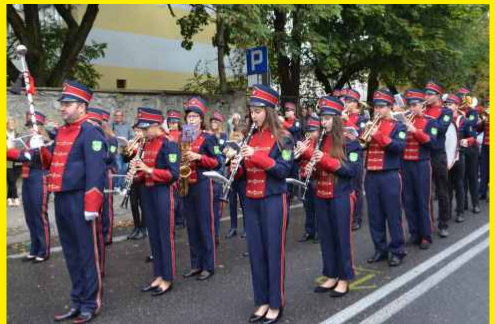
Młodzieżowa Orkiestra Dęta Gminy Godzianów