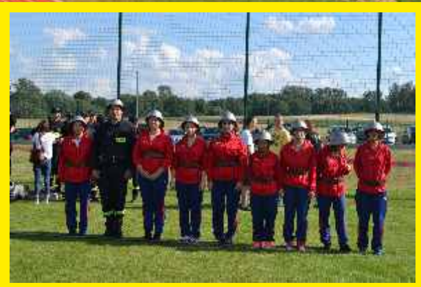
Gminny Stadion w Godzianowie