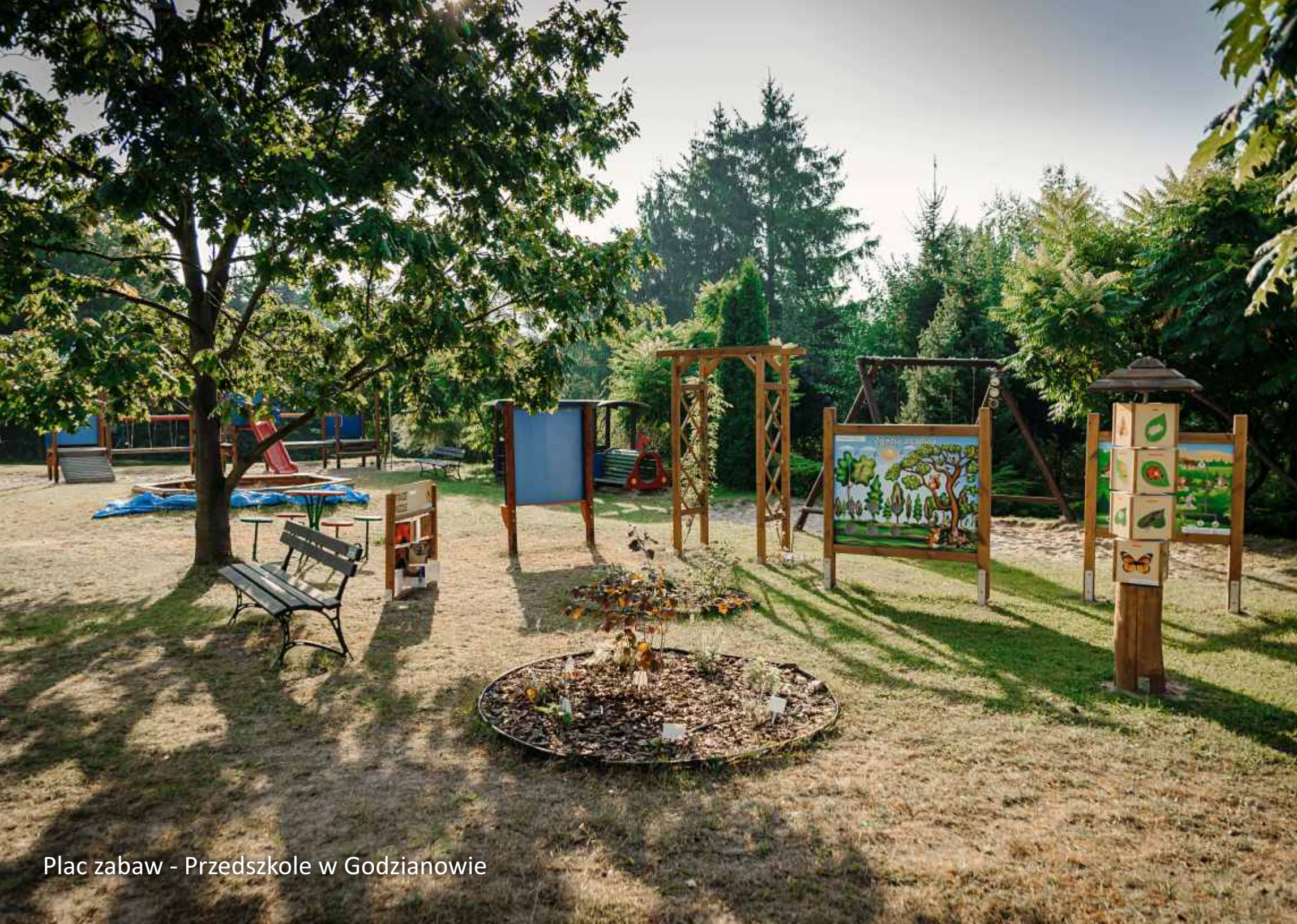
Plac zabaw - Przedszkole w Godzianowie