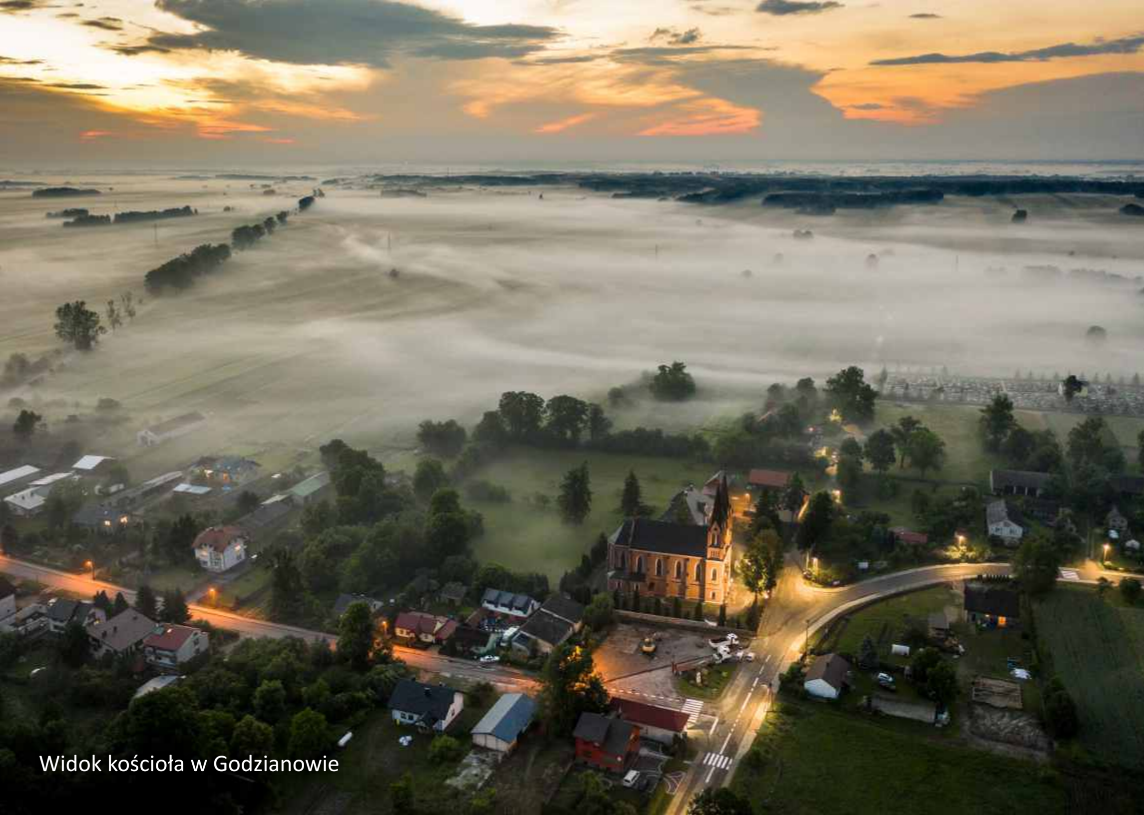
Widok kościoła w Godzianowie