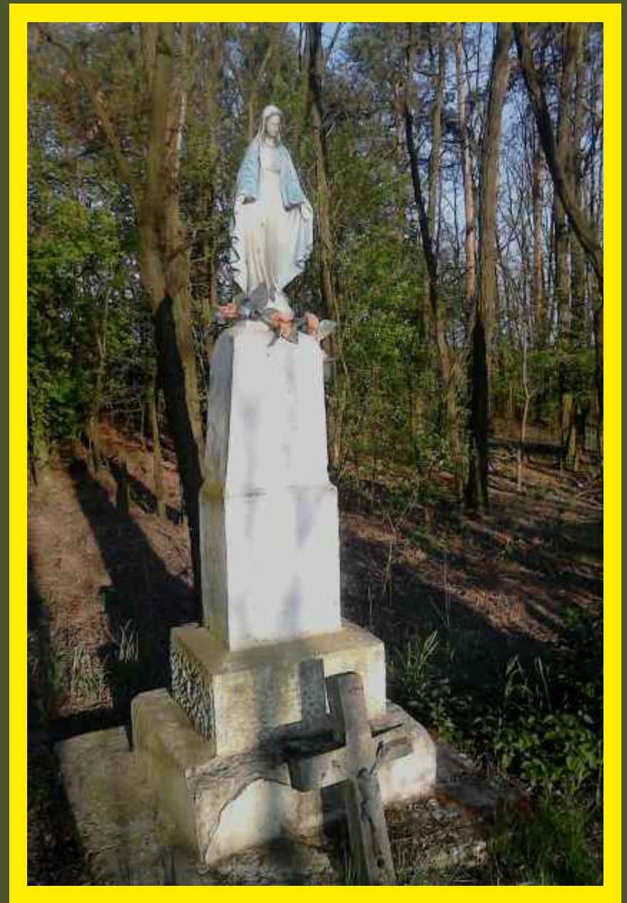
Kapliczka na granicy Gminy Godzianów i Gminy Maków