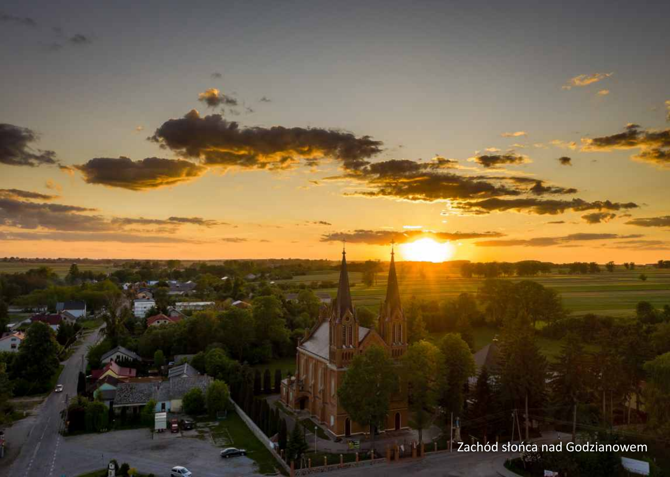
Zachód słońca nad Godzianowem