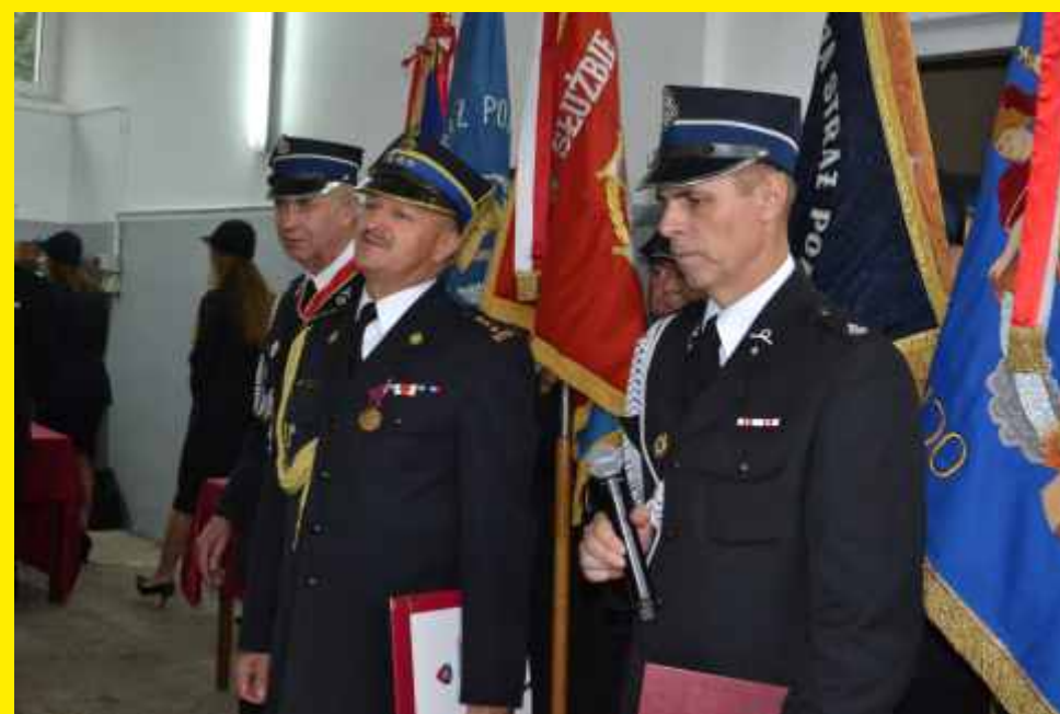
100-lecie OSP Godzianów