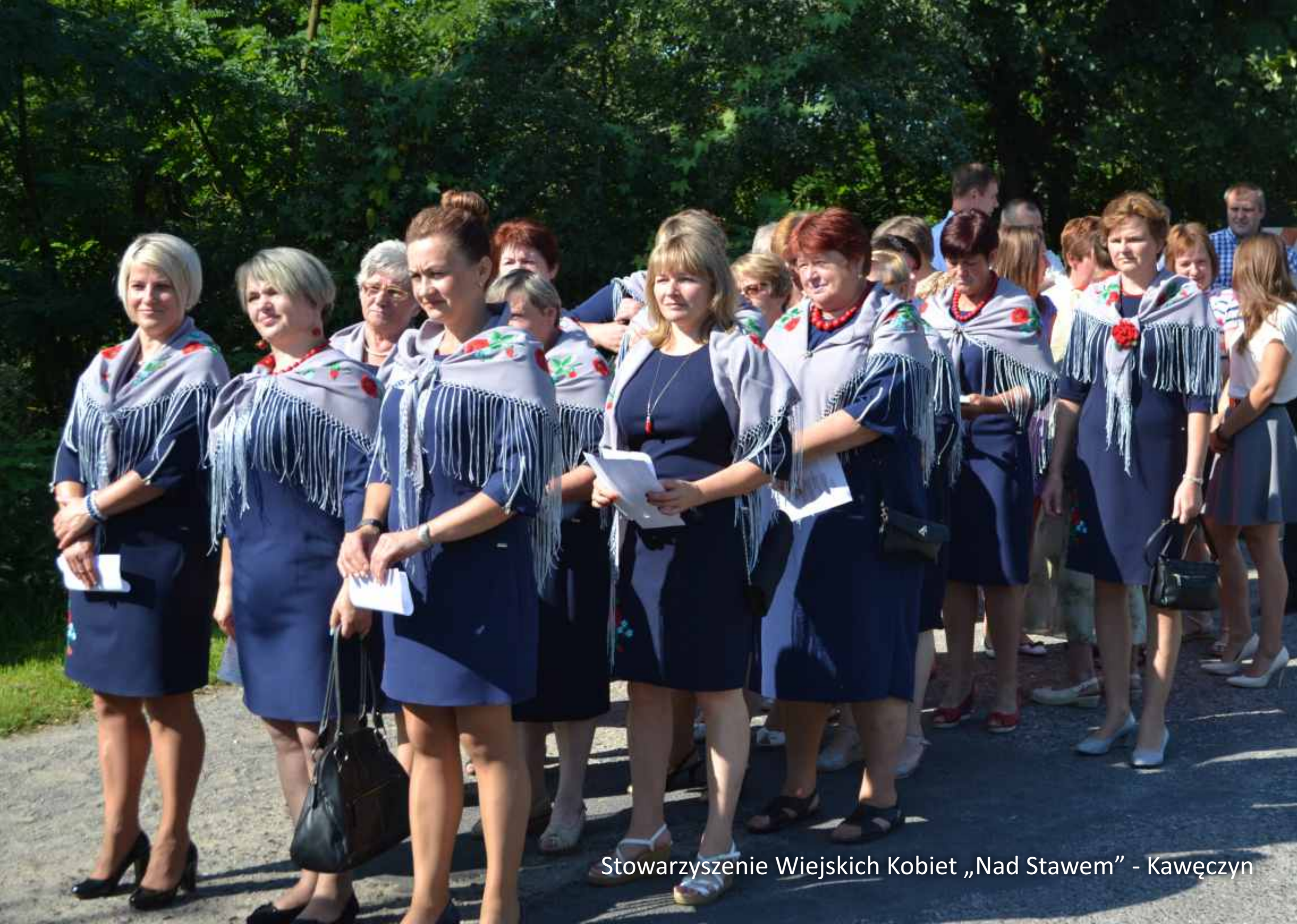
Stowarzyszenie Wiejskich Kobiet „Nad Stawem” - Kawęczyn