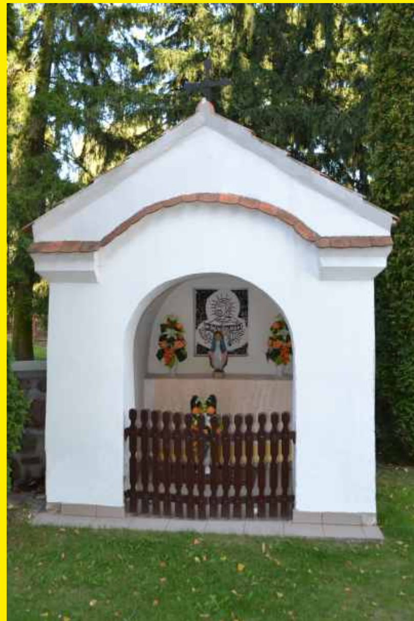
Kapliczki przy kościele parafialnym w Godzianowie