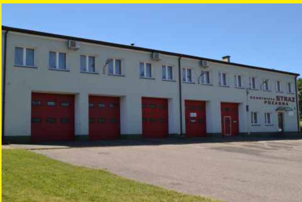
Nowa remiza OSP Godzianów