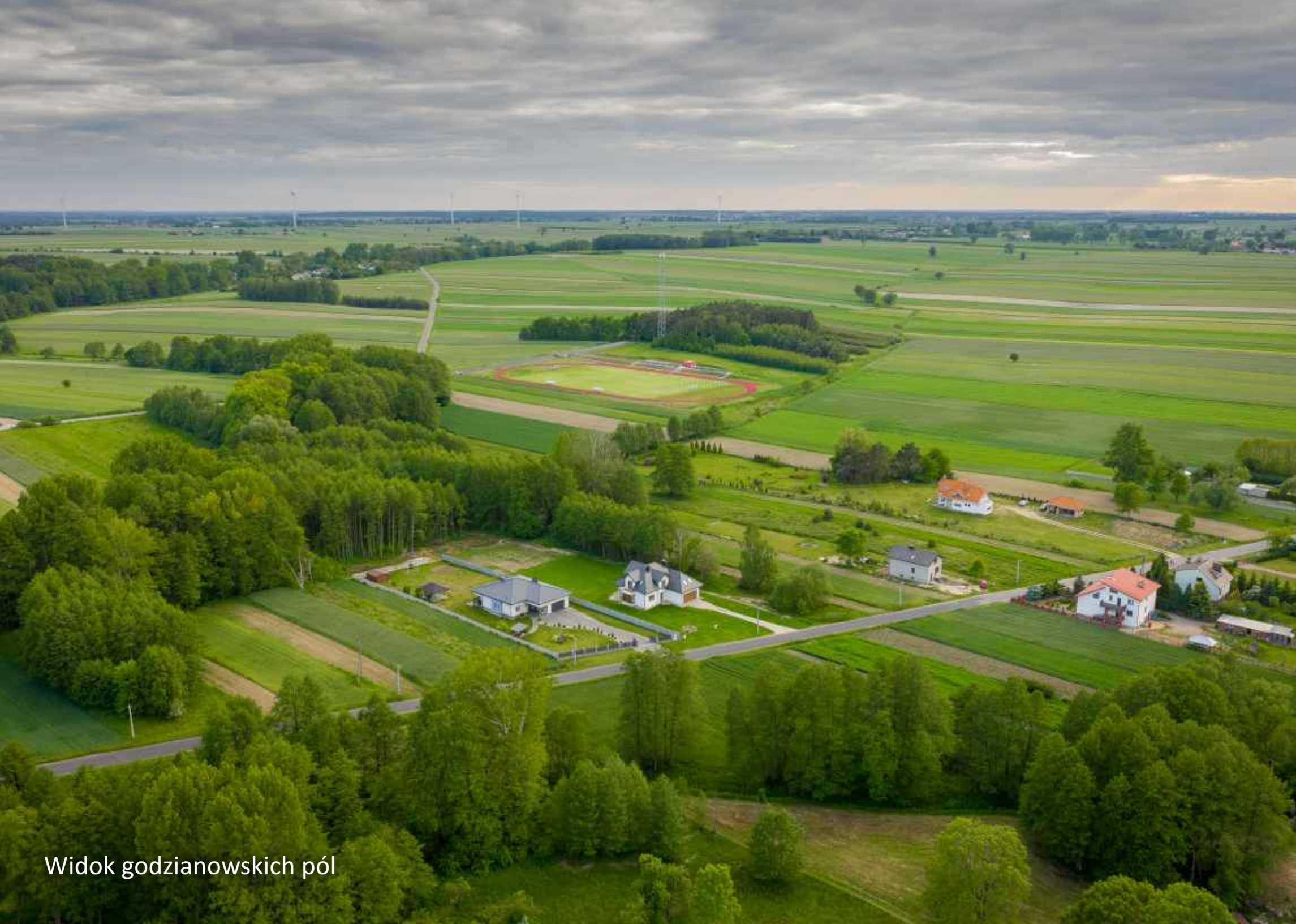
Widok godzianowskich pól