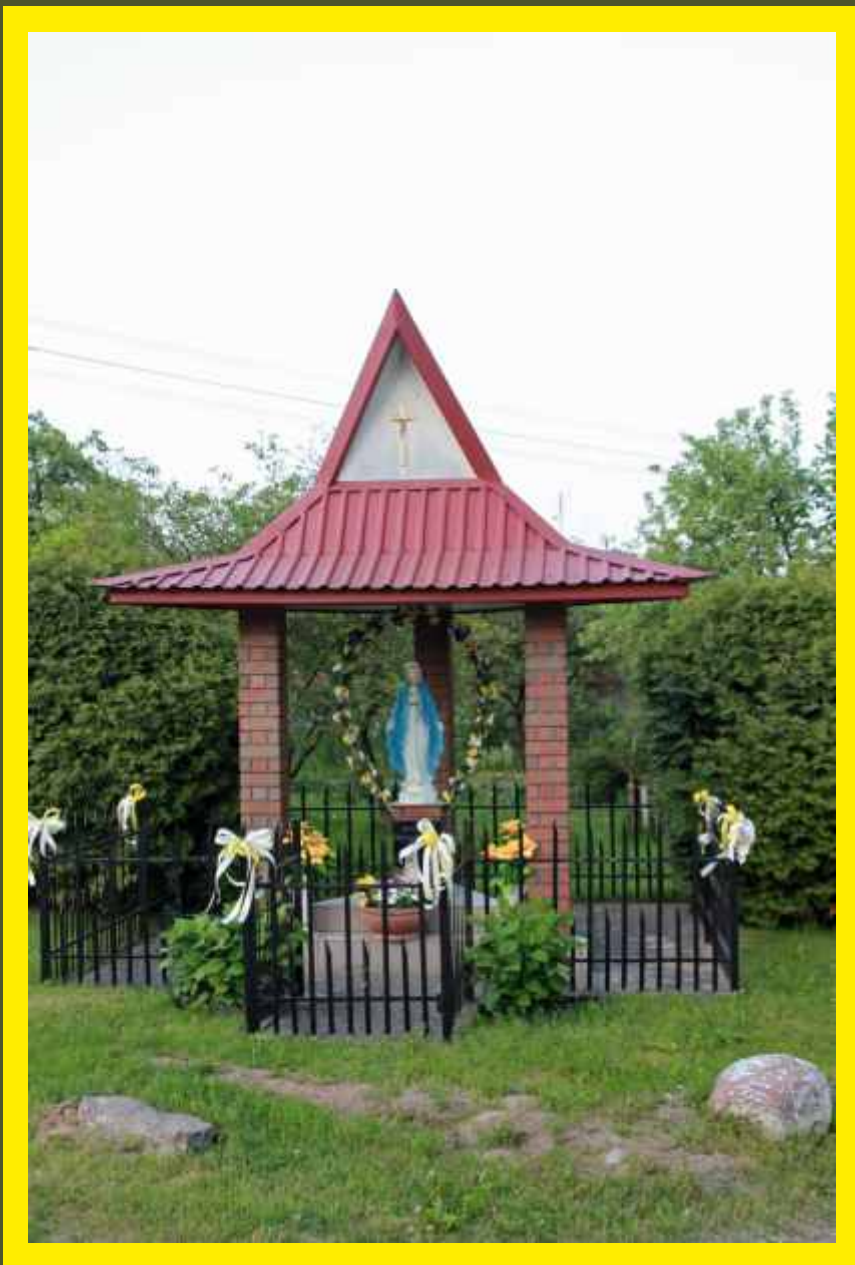
Kapliczka NMP w Godzianowie