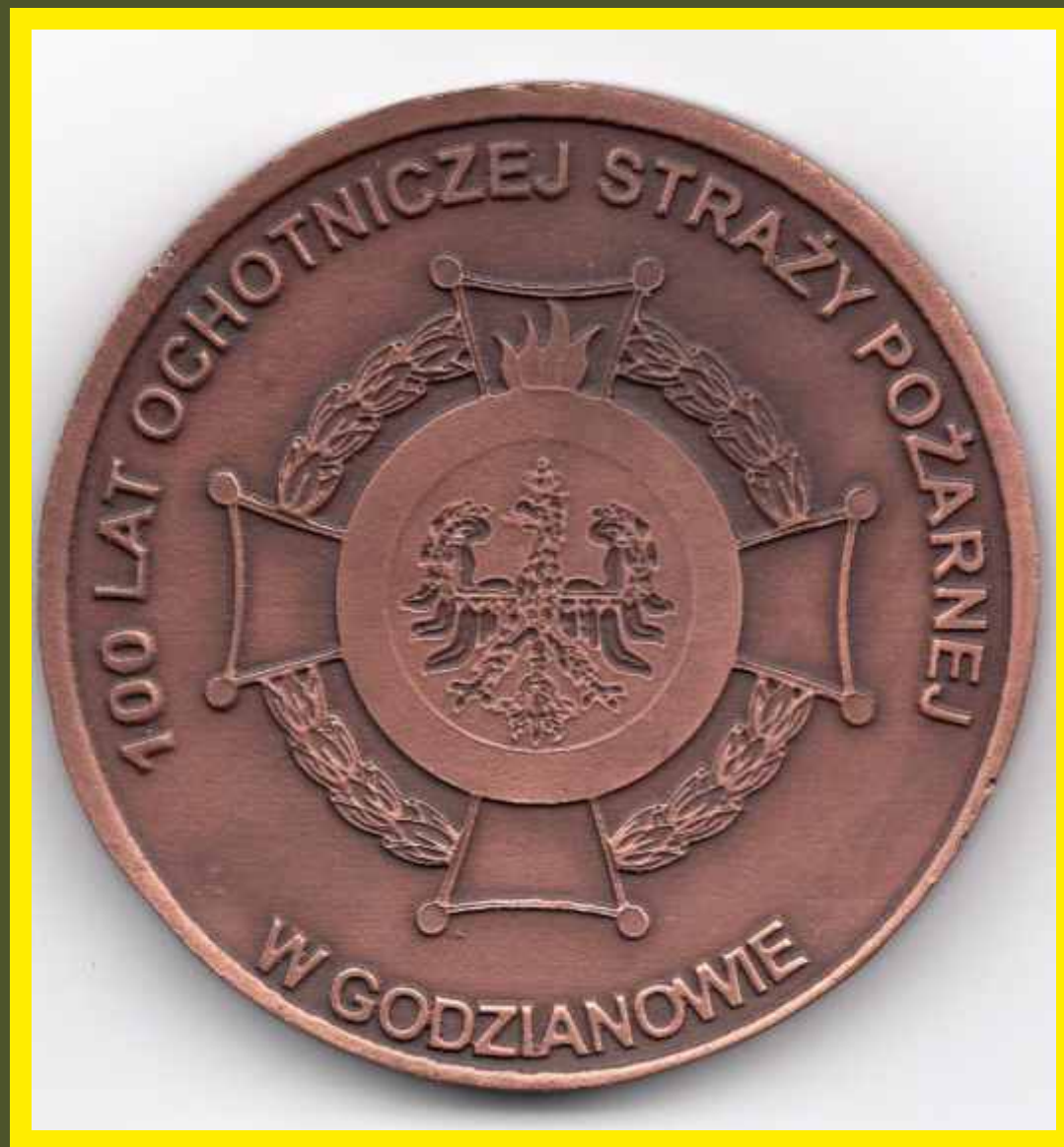
Medal wykonany w 2018 r. na 100 - lecie OSP Godzianów