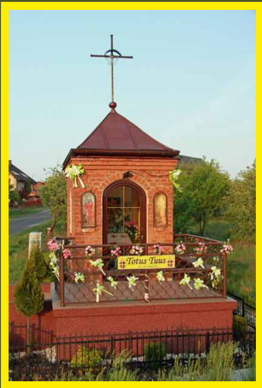
Kapliczka w Płyćwi