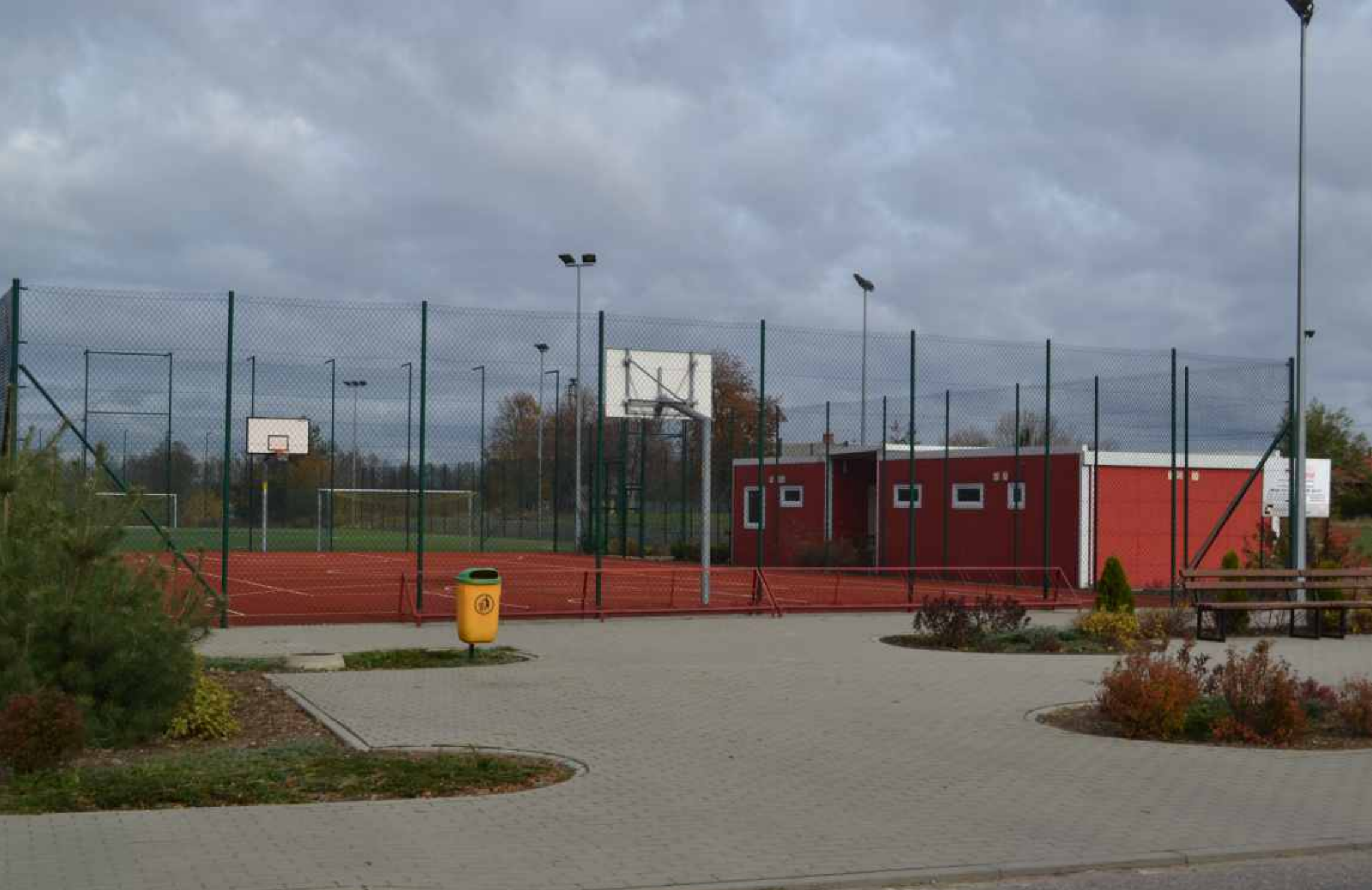
Boisko sportowe „Orlik” w Godzianowie