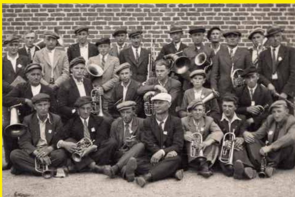
Godzianowska Orkiestra Dęta rok 1946