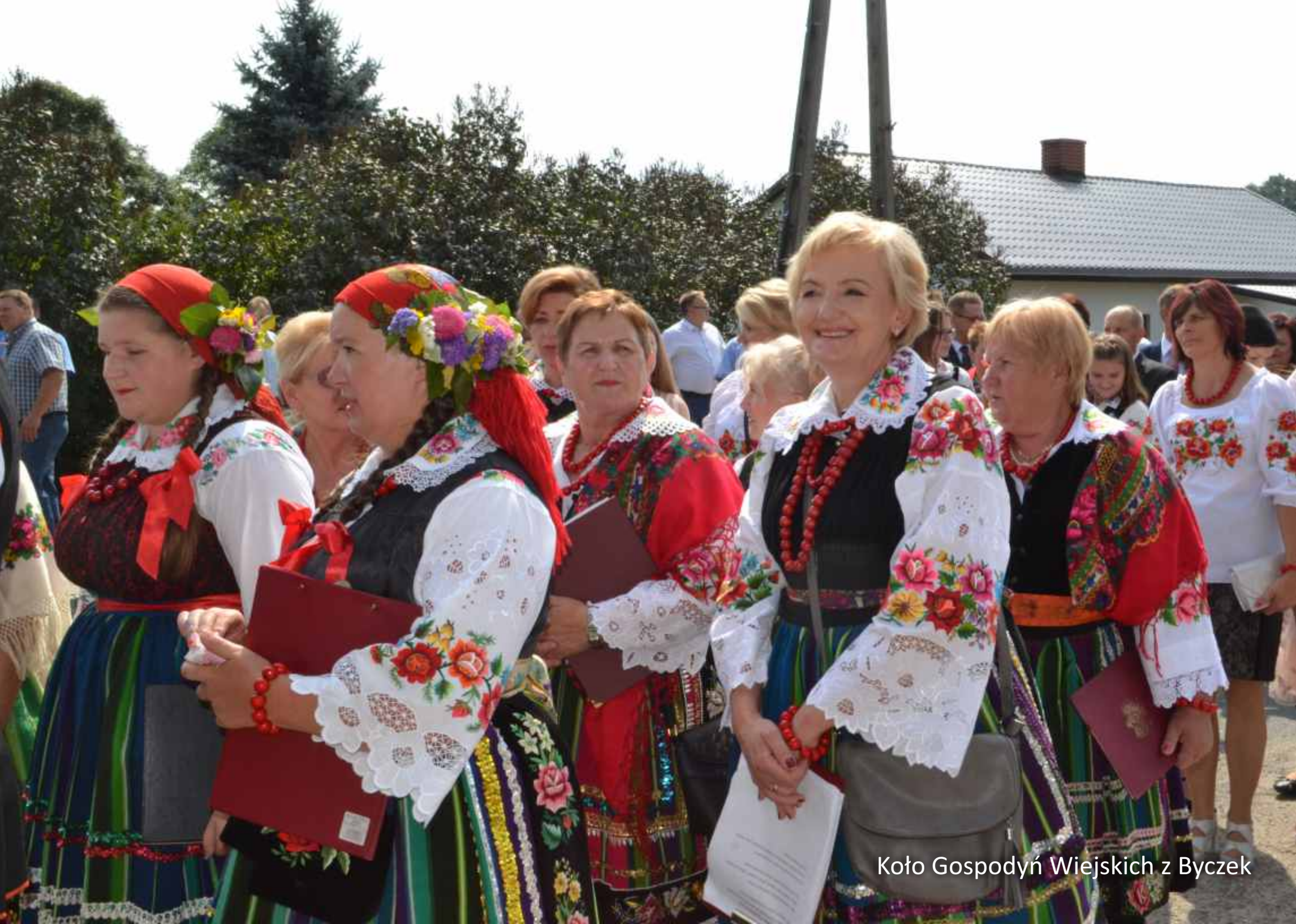
Koło Gospodyń Wiejskich z Byczek