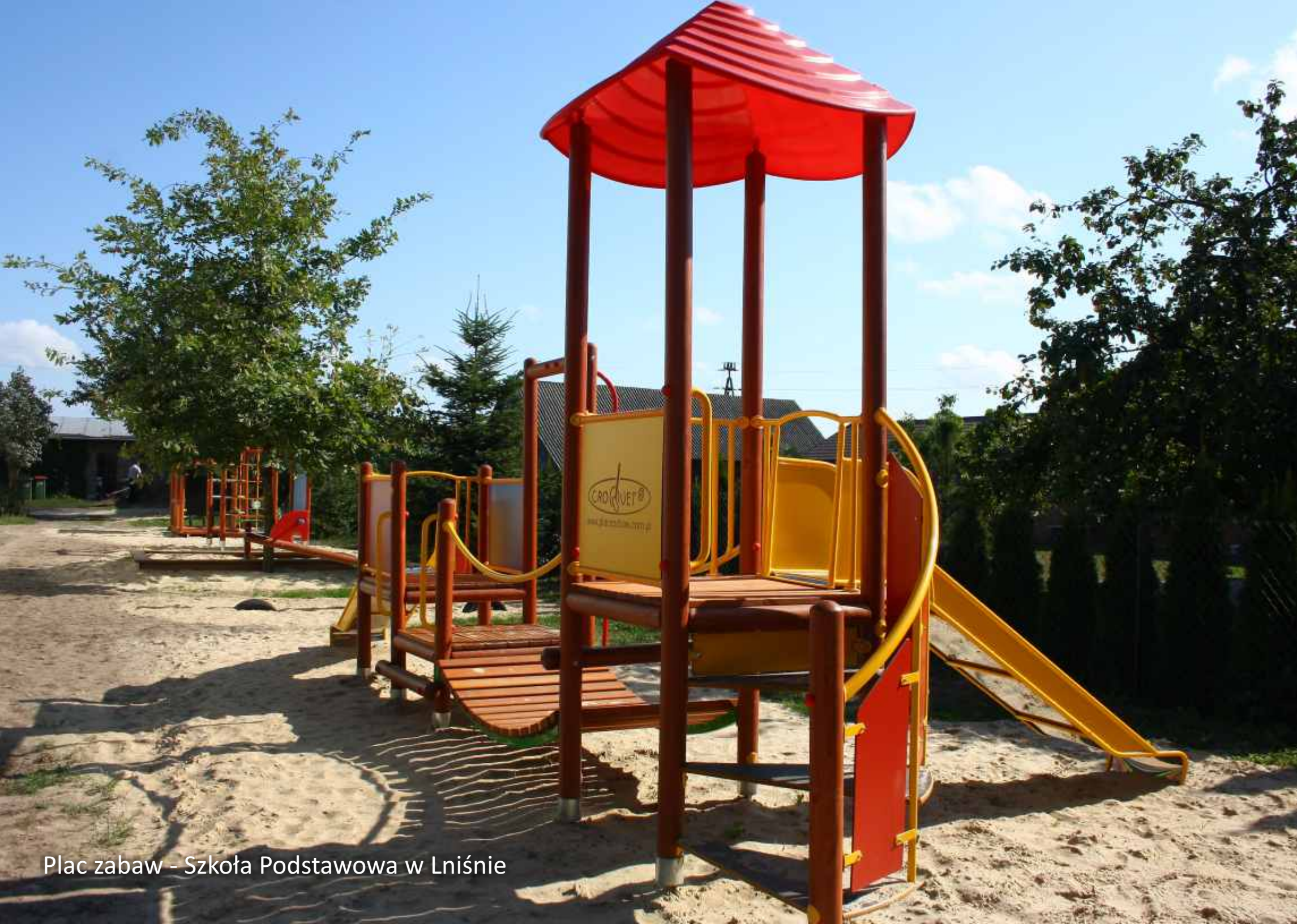
Plac zabaw - Szkoła Podstawowa w Lniźnie