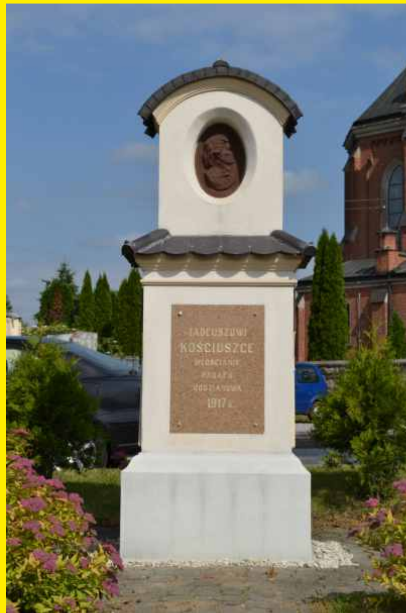
Pomnik Tadeusza Kościuszki wzniesiony na Placu Starej Wsi pod nowym budynkiem drewnianej szkoły. Na pomniku widnieje napis „Tadeuszowi Kościuszce - Włościanie parafii Godzianowa” - 1917 r. Obecnie jest to miejsce obchodów gminnych uroczystości patriotycznych.