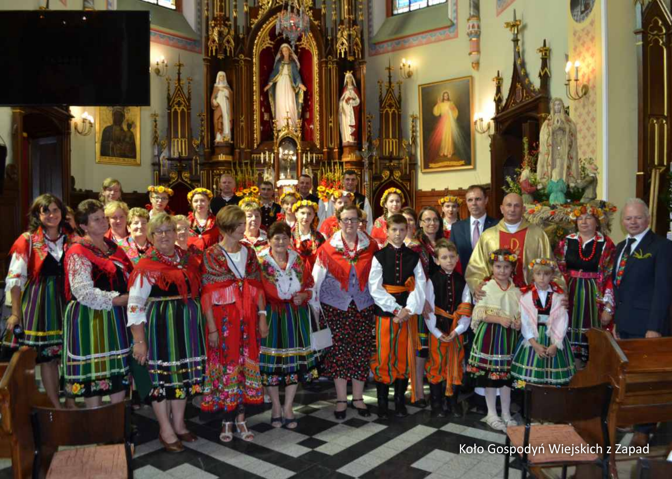
Koło Gospodyń Wiejskich z Zapad