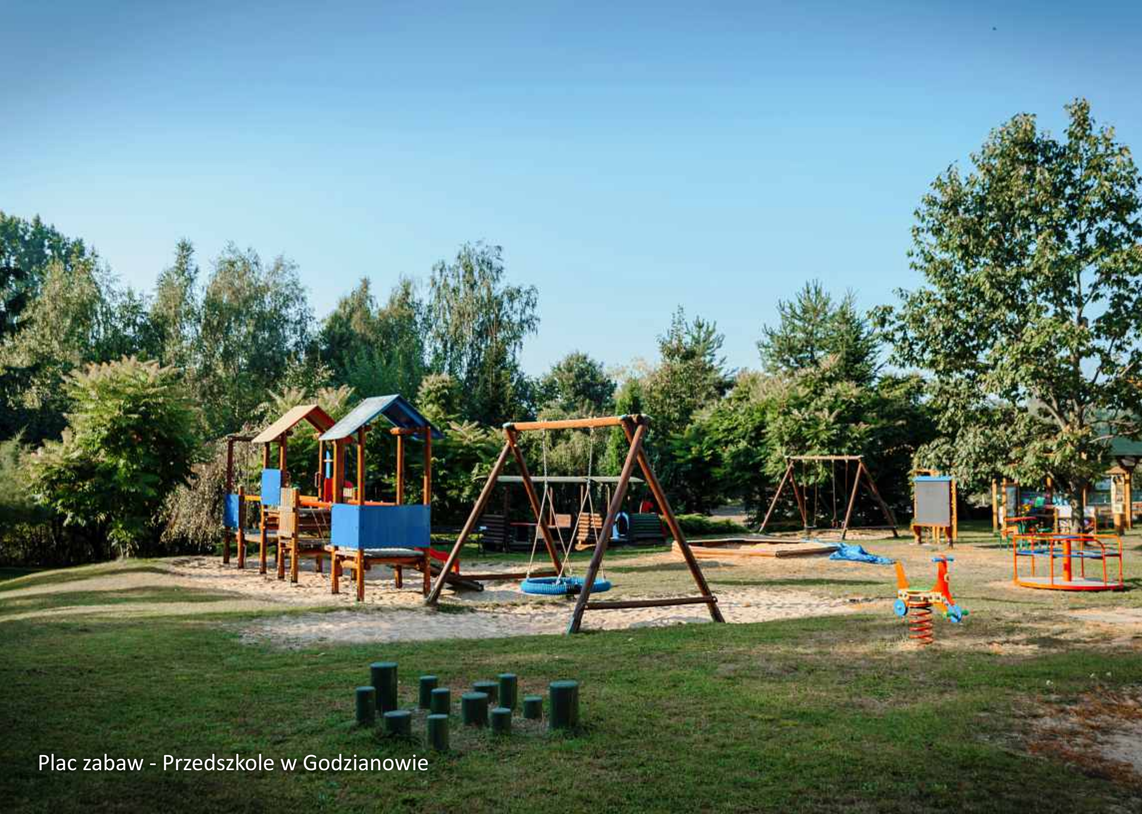
Plac zabaw - Przedszkole w Godzianowie