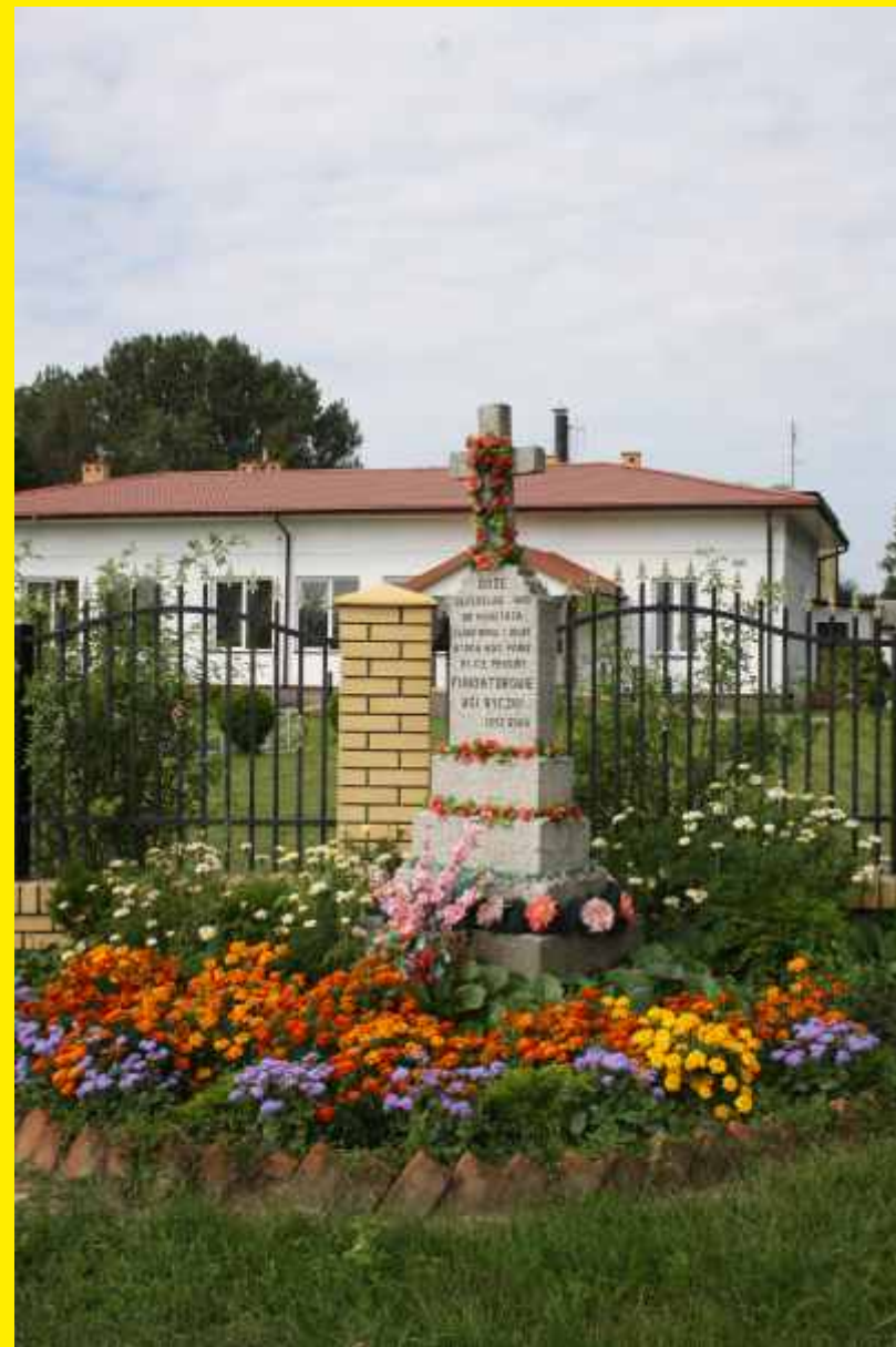
Przydrożny krzyż w Byczkach